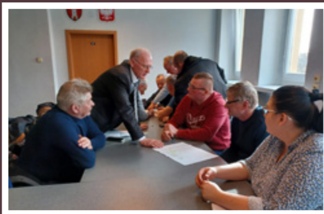
„Europejski Fundusz Rolny na rzecz Rozwoju Obszarów Wiejskich: