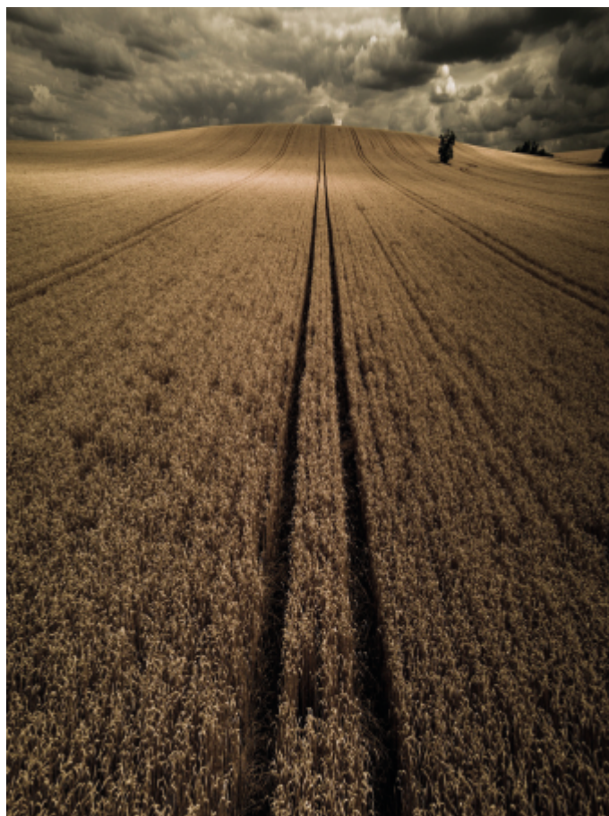
Łukasz Rajs „Polskie złoto”