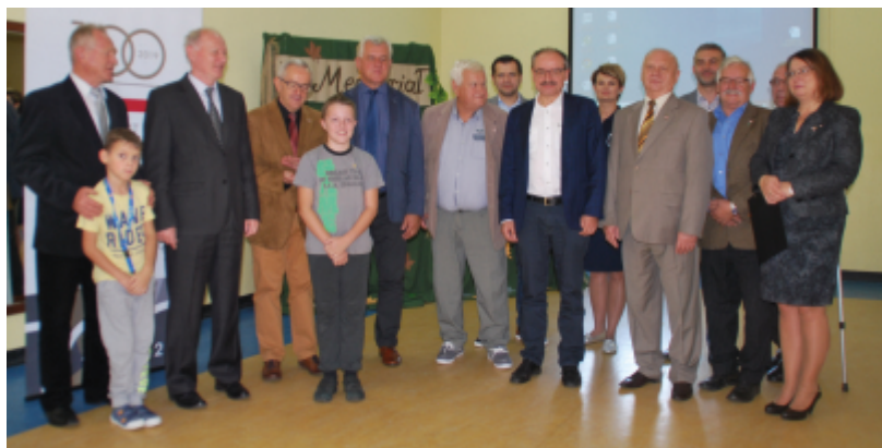
Nagrodzeni z organizatorami