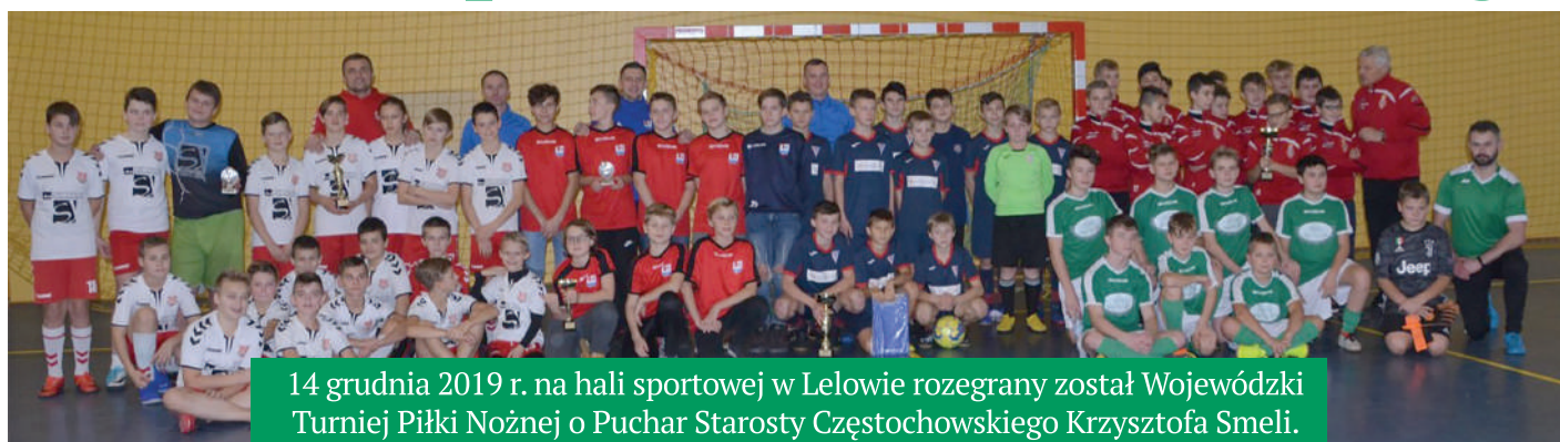
14 grudnia 2019 r. na hali sportowej w Lelowie rozegrany został Wojewódzki Turniej Piłki Nożnej o Puchar Starosty Częstochowskiego Krzysztofa Smeli.