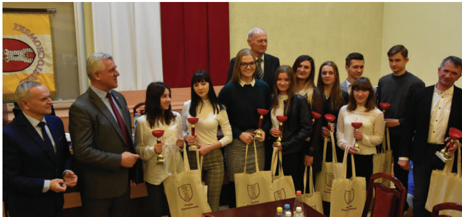
Reprezentacja Dragona Janów