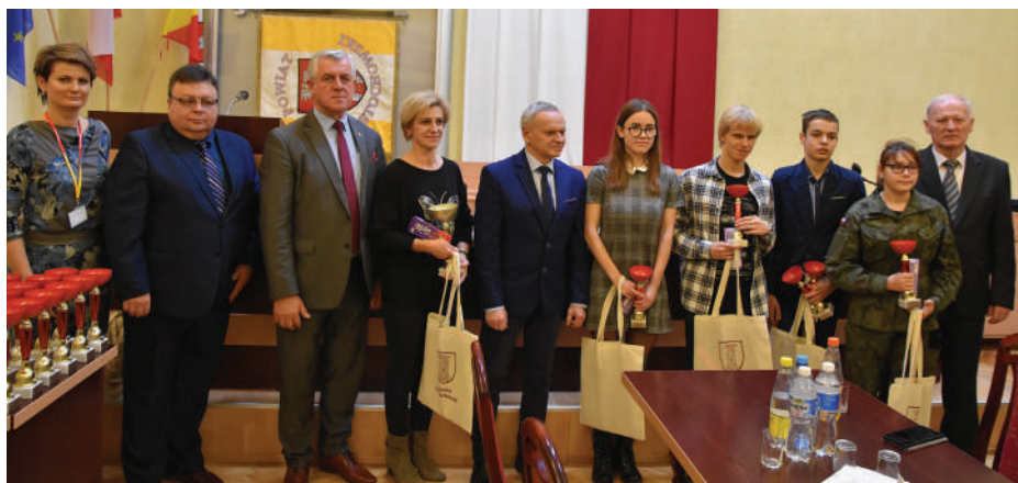
Zawodnicy GOL-START Częstochowa