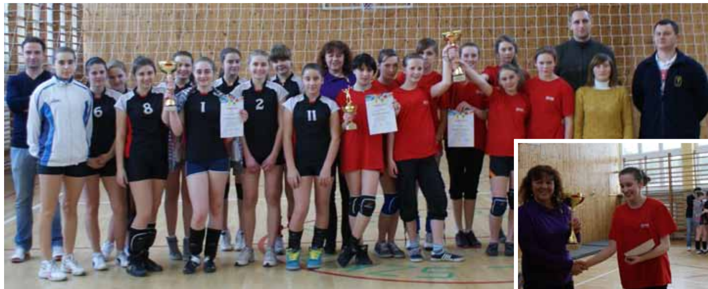
Drużyny z Gimnazjum w Mykanowie i Piasku