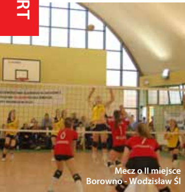
Mecz o II miejsce Borowno - Wodzisław Śl