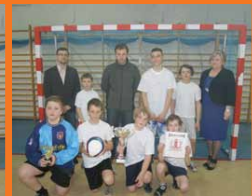
Najlepsza drużyna z Woli Mokrzeskiej