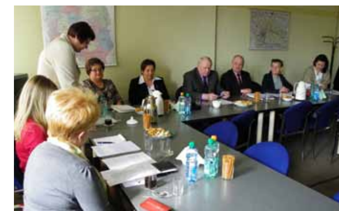
Powiatowa Społeczna Rada ds. Osób Niepełnosprawnych zaakceptowała podział środków PFRON