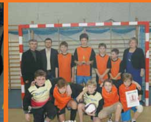
Drużyna z Przyrowa