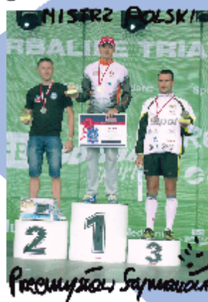
Najlepsi zawodnicy MP w aquathlonie na podium