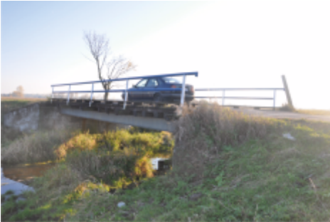
Most w Dąbrowie Zielonej obecnie