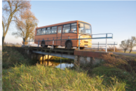
Most w Raczkowicach przed przebudową