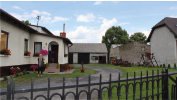
Posesja A. Motłoch z Zarębic - III m.