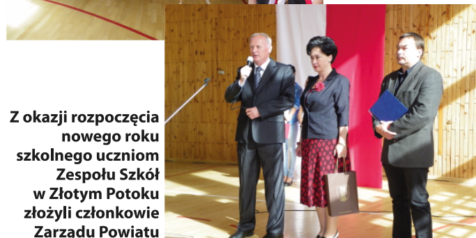
Z okazji rozpoczęcia nowego roku szkolnego uczniom Zespołu Szkół w Złotym Potoku złożyli członkowie Zarządu Powiatu