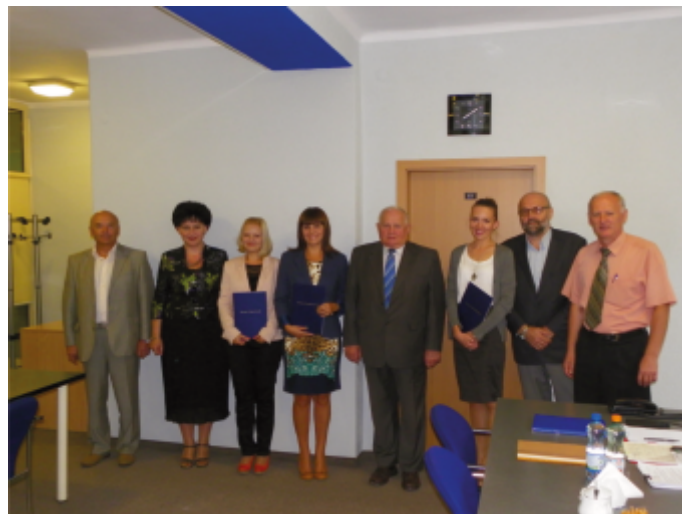
Mianowani nauczyciele z władzami powiatu