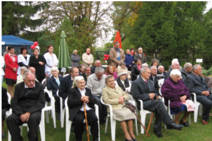
Mieszkańcy DPS i ich bliscy