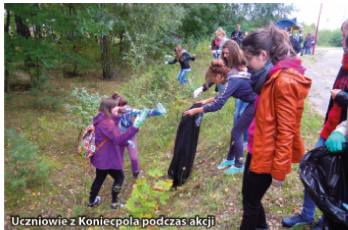
Uczniowie z Koniecpola podczas akcji

Zwieńczeniem akcji było posadzenie na terenie Zespołu Szkół Ponadgimnazjalnych drzew przekazanych przez Nadleśnictwo Koniecpol.