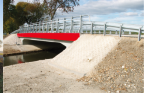
Most w Raczkowicach po przebudowie

W ramach otrzymanej z Rezerwy Subwencji Ogólnej Ministerstwa Transportu, Budownictwa i Gospodarki Morskiej dotacji w wysokości 596,9 tys. zł Powiatowy Zarząd Dróg w Częstochowie zakończył przebudowę mostu w miejscowości Raczkowice gmina Dąbrowa Zielona w (ciągu drogi powiatowej nr 1083 S), a w najbliższych dniach rozpocznie przebudowę mostu w Dąbrowie Zielonej. Oba mosty posiadały status mostów tymczasowych, a po przebudowie uzyskają klasę A. Konieczność przebudowy istniejących obiektów wynikała z ich złego stanu technicznego, oraz zbyt małej nośności.