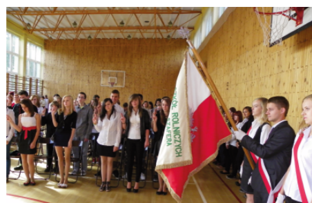
Ślubowanie uczniów klas pierwszych w Złotym Potoku