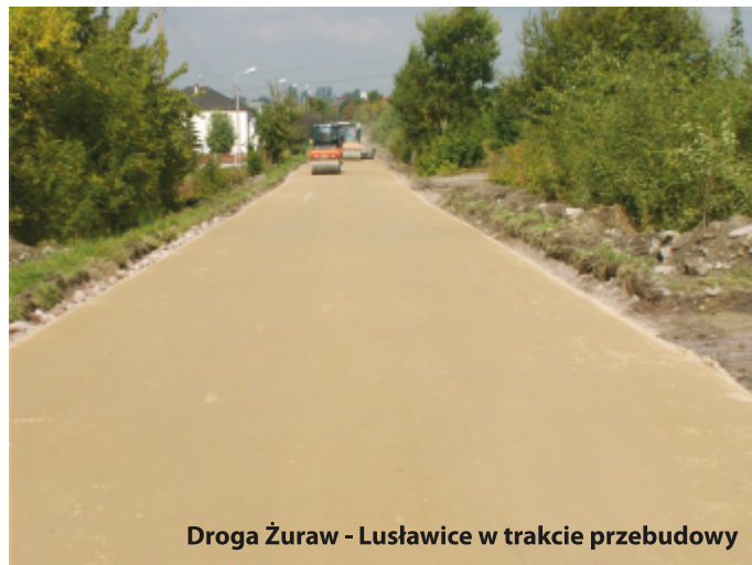
Droga Żuraw - Lusławice w trakcie przebudowy

Roboty będą trwały do 30 listopada br. Wykonuje je Przedsiębiorstwo Handlowo-Usługowe „LARIX” sp. z o.o. z siedzibą w Lublińcu za kwotę 4 mln 550 tysięcy 580zł.