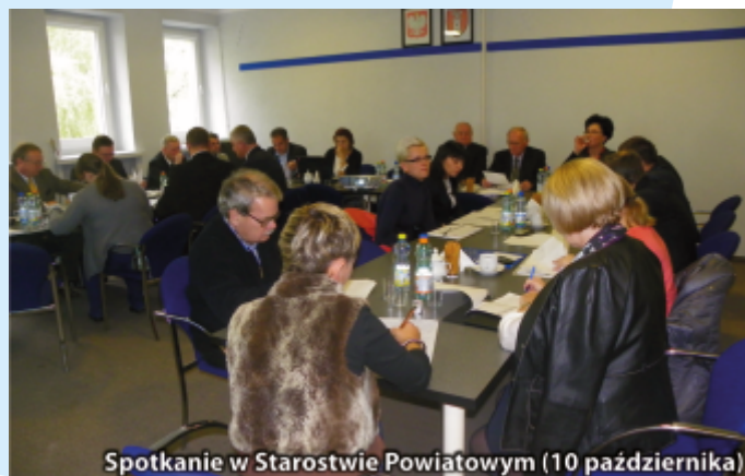
Spotkanie w Starostwie Powiatowym (10 października)