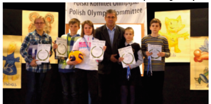
Laureaci Szkoły Podstawowe