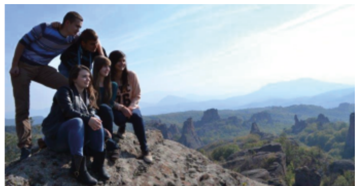
Uczniowie liceum na tle skałek w Belogradchik