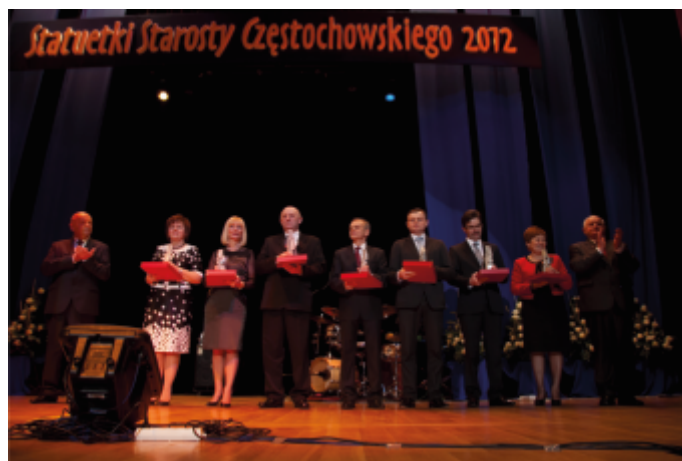
Laureaci ubiegłorocznej edycji