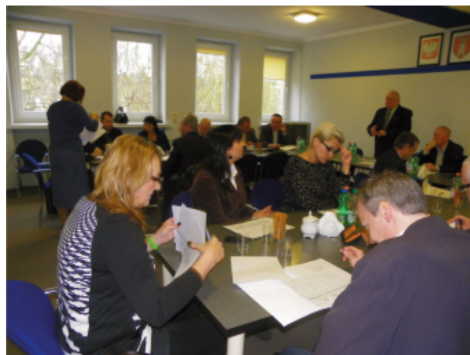
Jedna z listopadowych narad w starostwie