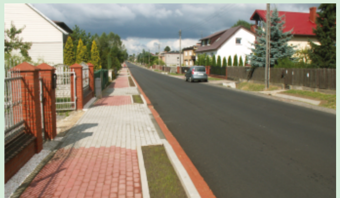
Droga w Mykanowie