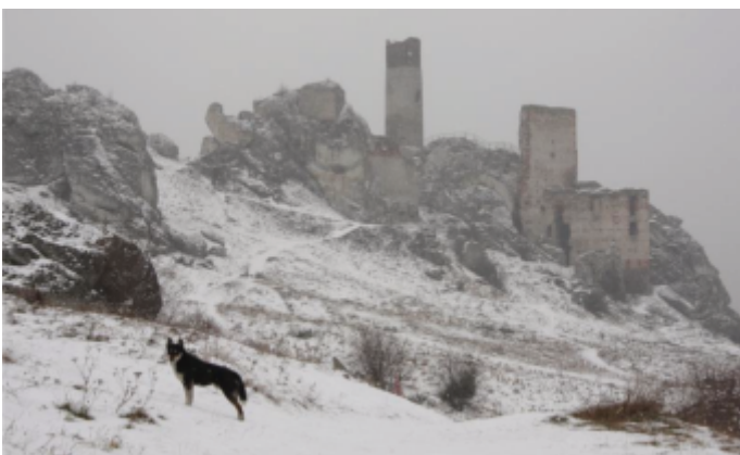
Turkus Zimowy Olsztyn