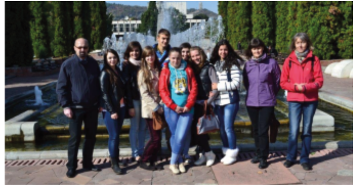
Delegacja liceum na tle fontanny w Montana