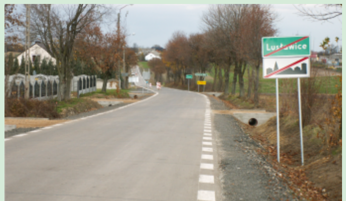
Droga Żuraw -Lusławice