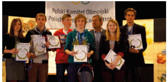
Laureaci Szkoły Ponadgimnazjalne