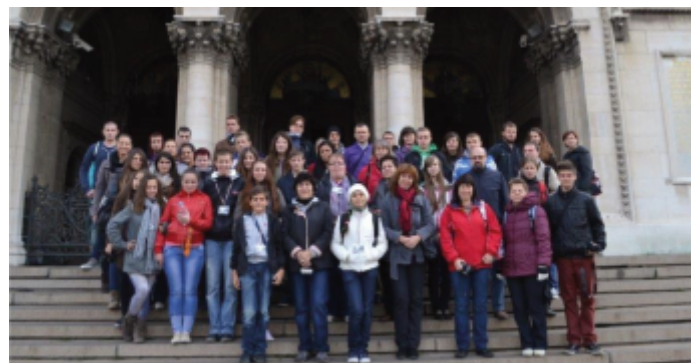
Uczestnicy spotkania przed katedrą w Sofii