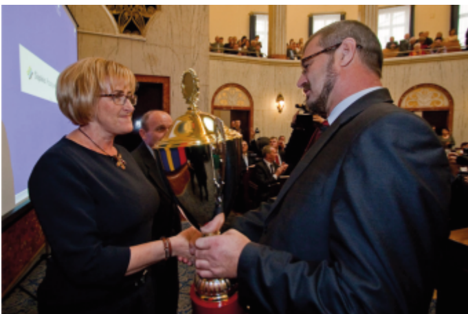
Forum Sołtysów Województwa Śląskiego