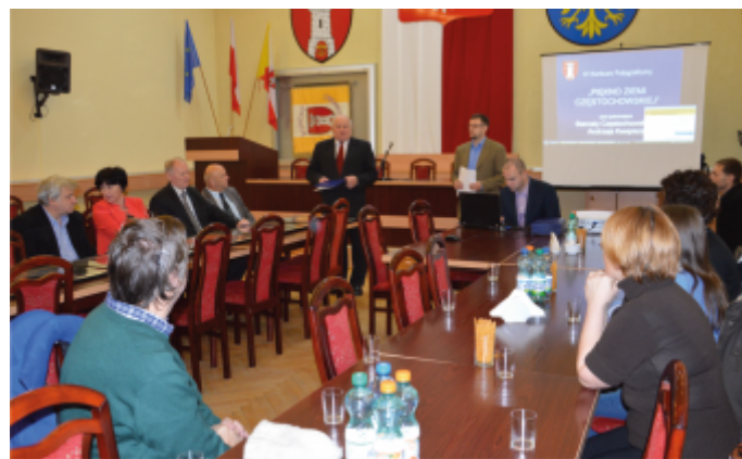
Ogłoszenie wyników konkursu