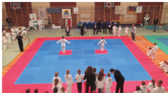
Przed układami dziewcząt