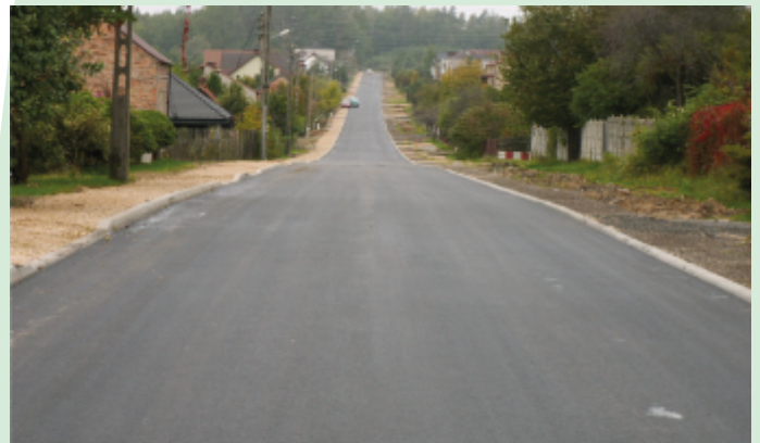
Droga w Hutkach