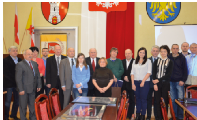
Autorzy nagrodzonych zdjęć z władzami powiatu i jurorami