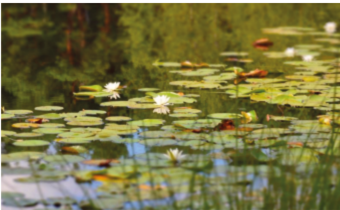
Kludia Musiał, Pływające skarby