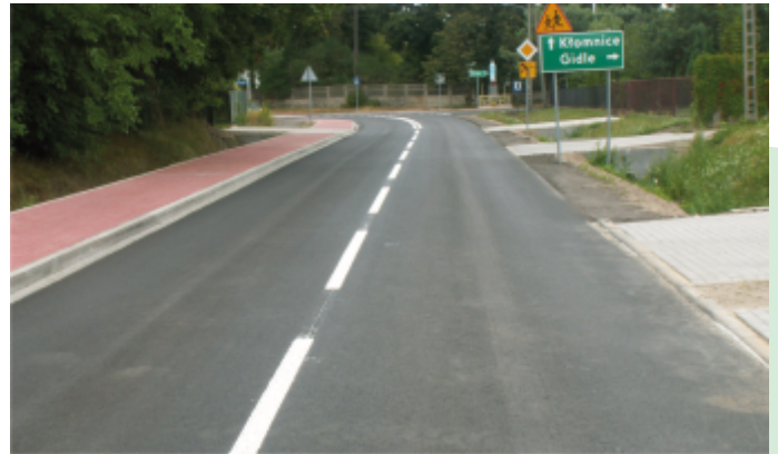
Droga w Garnku