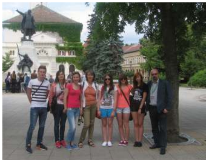
W centrum Kecskemet