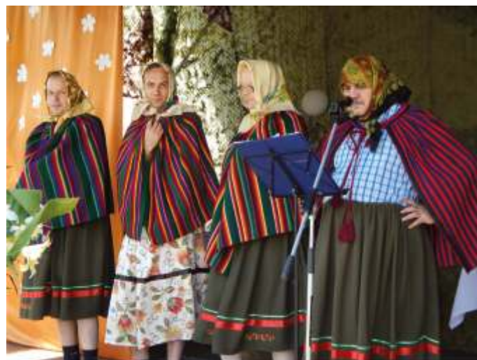
Występ mieszkanki DPS