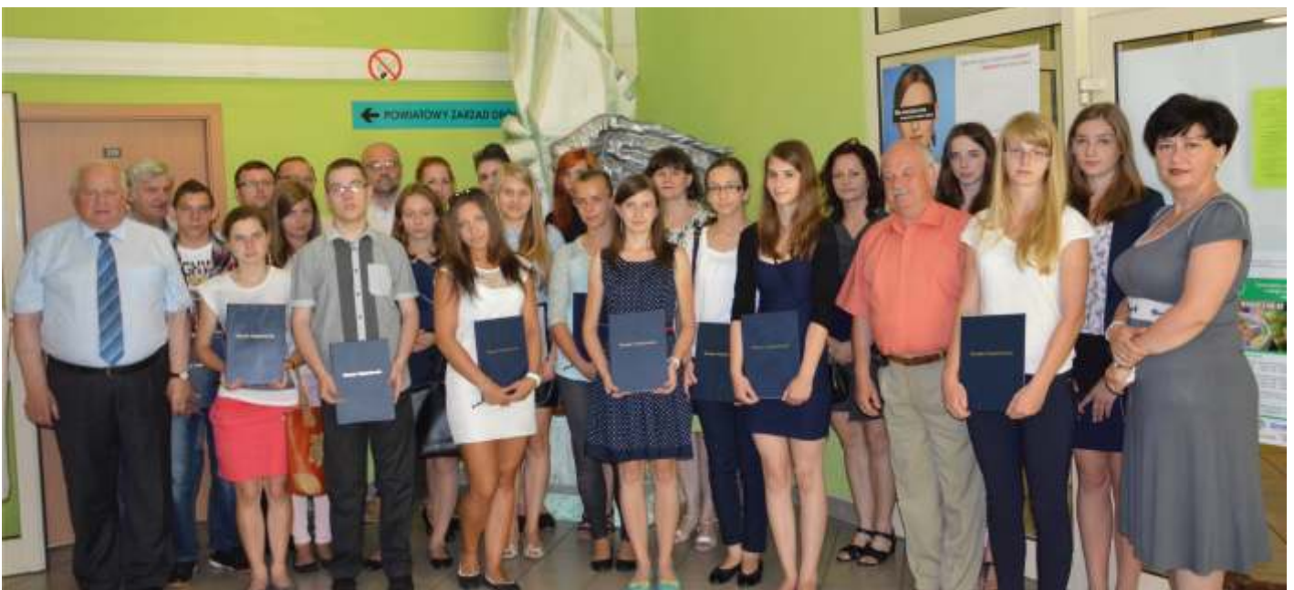
Stypendiści z władzami powiatu