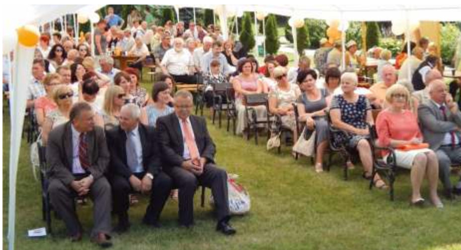
Do Lelowa przybyło ponad 200 gości