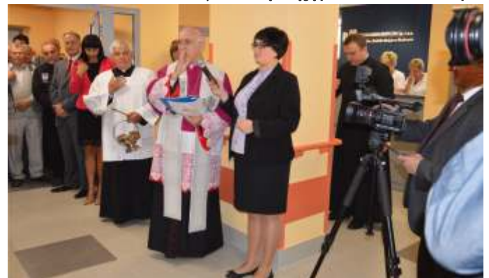
Placówkę poświęcił abp. W. Depo