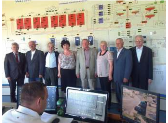
Radni w oczyszczalni ścieków