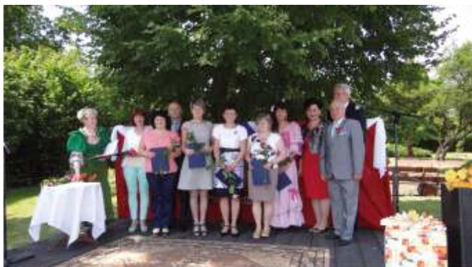
Nagrodzeni pracownicy DPS w Blachowni z przedstawicielami władz powiatu