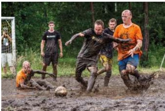
Mecz finałowy Białystok Blachownia