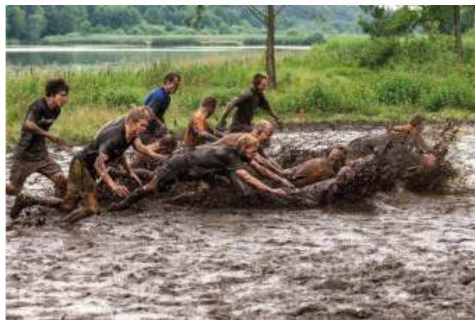
Radość okazywana przez zwycięzców