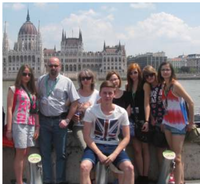
Na tle Parlamentu Węgier