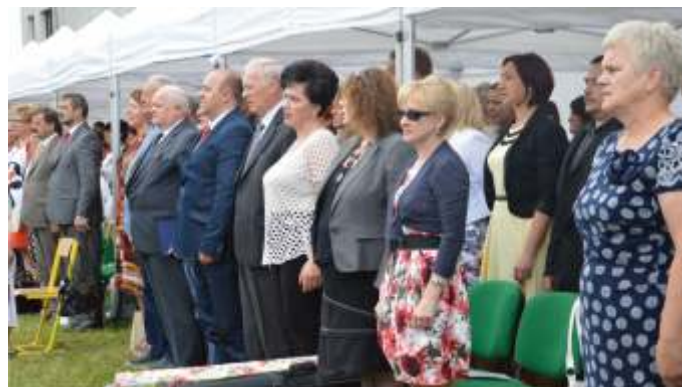
Przedstawiciele władz powiatu podczas jubileuszowych uroczystości