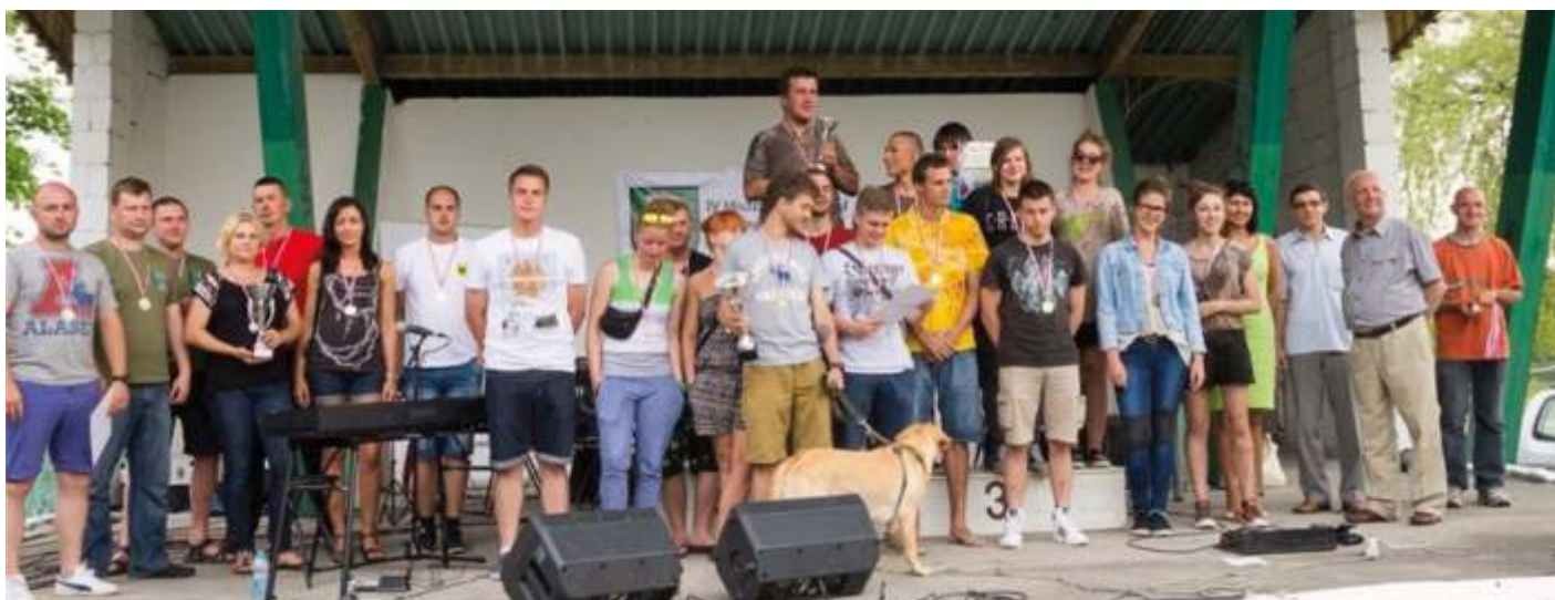
Najlepsze drużyny mieszane z organizatorami mistrzostw