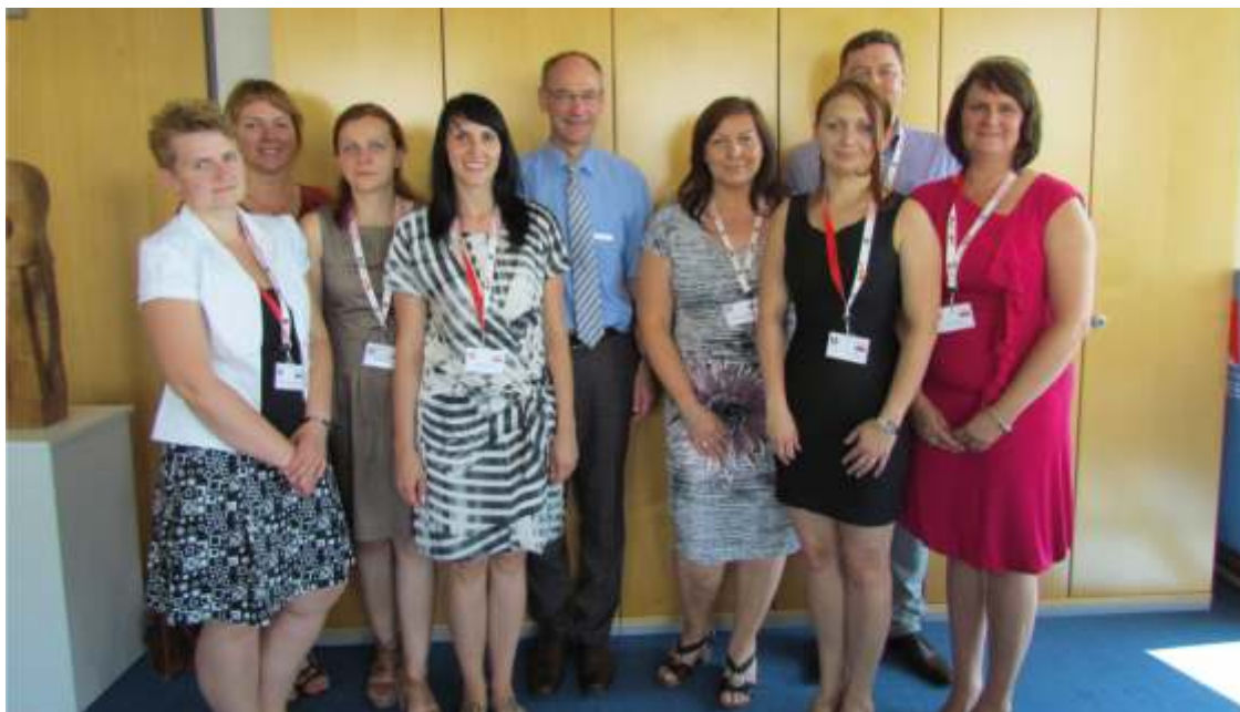
Pracownicy PCPR ze starostą bodeńskim