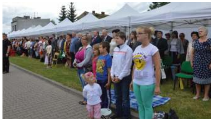
Do Bogumiłka przyjechało ponad 400 osób