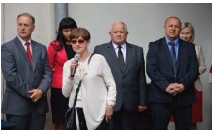
Głos zabrała wnuczka patrona szpitala