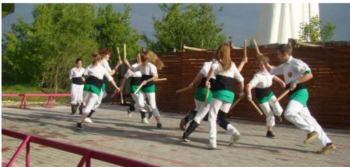
Kataloński taniec z kijami