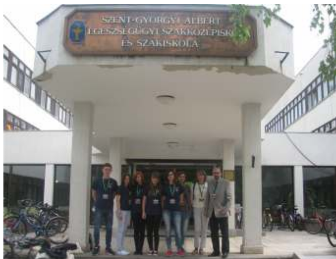
Przed szkołą w Kecskemet