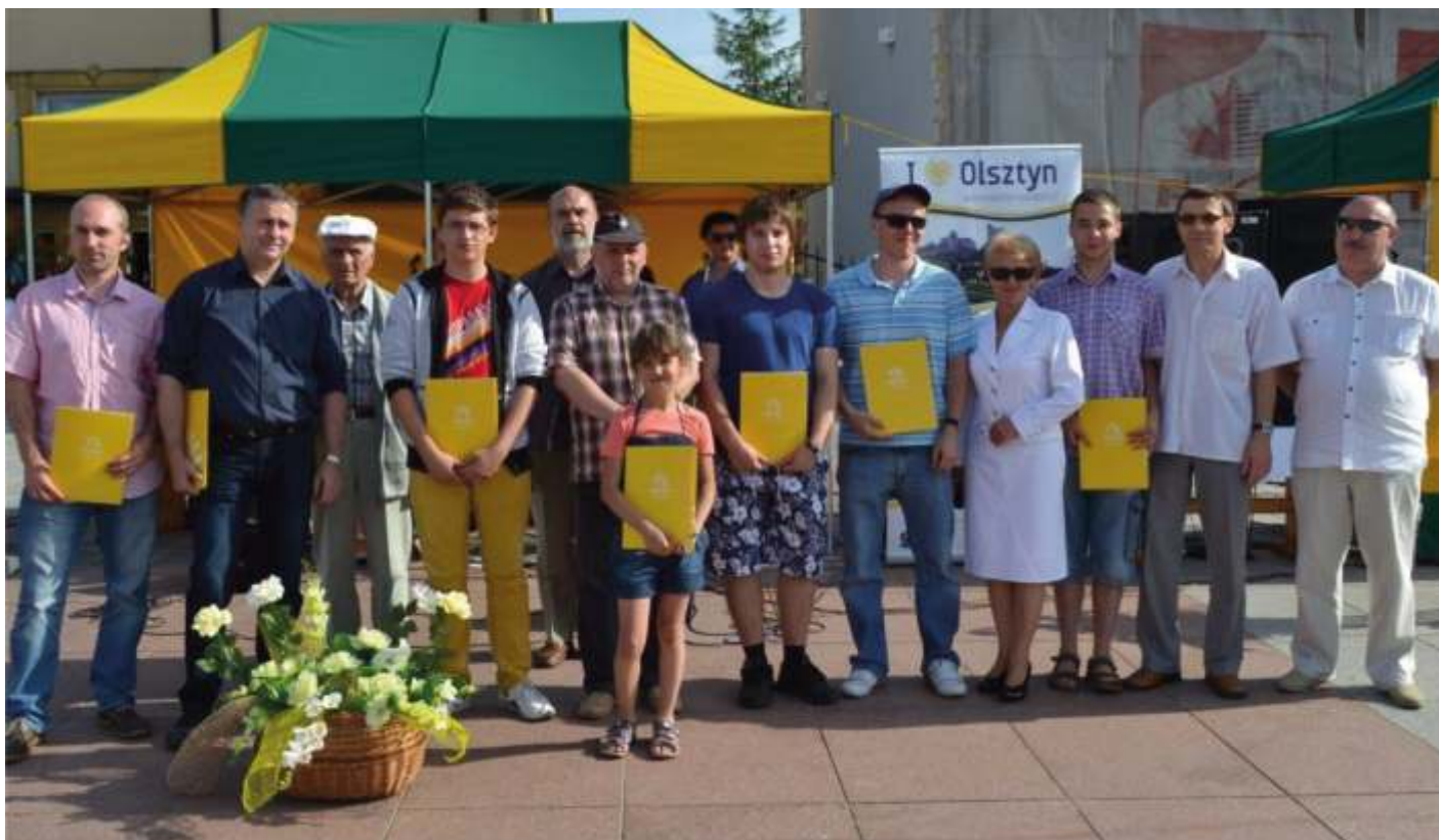
Najlepsi zawodnicy z organizatorami turnieju