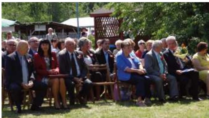
Goście nie zawiedli mieszkańców i pracowników blachowiańskiego DPS