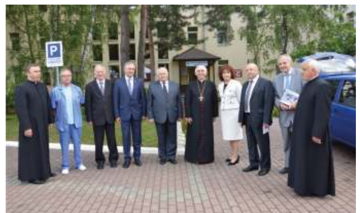
Pamiątkowe zdjęcie na koniec uroczystości