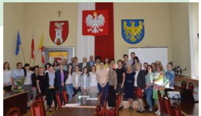
Uczestnicy i organizatorzy konkursu