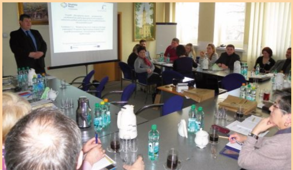
Spotkanie w Starostwie