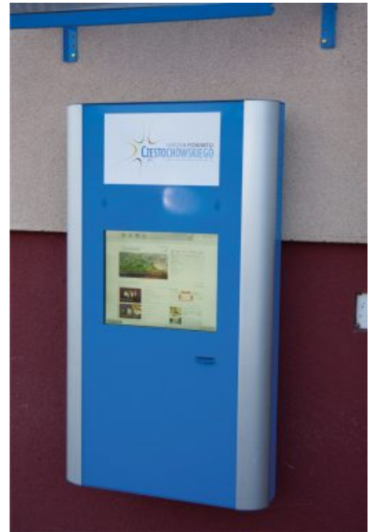
Infomat dla mieszkańców przy Urzędzie Gminy