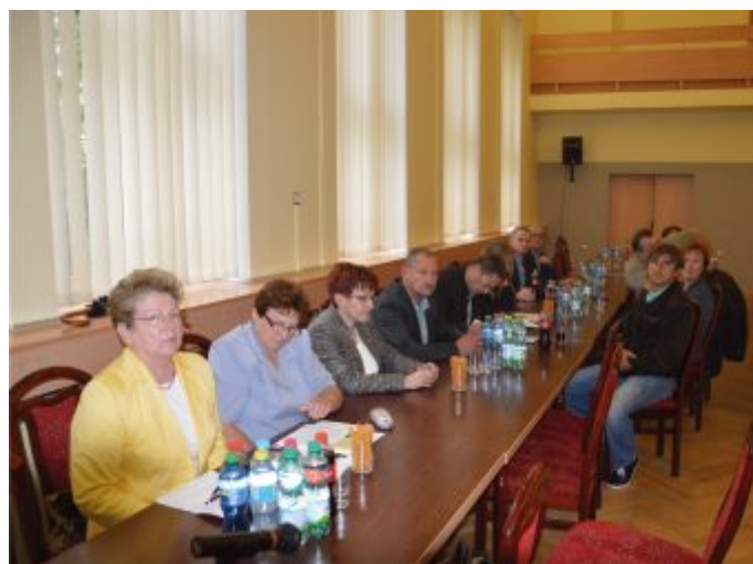
Spotkanie w starostwie

– W naszym szpitalu przede wszystkim liczy się zdrowie i dobro pacjenta. Zgłasza się do nas wielu mieszkańców powiatu częstochowskiego, jak i powiatów ościennych. Coraz więcej kobiet decyduje się na poród w naszym szpitalu. Jak same mówią, cenią sobie u nas przyjazną, kameralną atmosferę i fachowość. I to właśnie z myślą o nich chcemy już niebawem uruchomić bezpłatną szkołę rodzenia dla przyszłych rodziców. Zamierzamy wprowadzić bezpłatne porody bez bólu. Pacjentki same zdecydują, czy będą chciały otrzymać znieczulenie podczas porodu. Naszym zamiarem jest również przeprowadzenie remontu części porodowej Oddziału ginekologiczno –