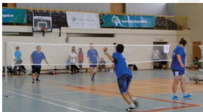
Rozgrzewka przed meczem