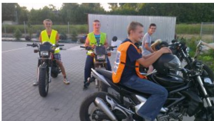
Uczestnicy kursu w trakcie egzaminu na prawo jazdy w ramach projektu „Mam zawód mam pracę w regionie”