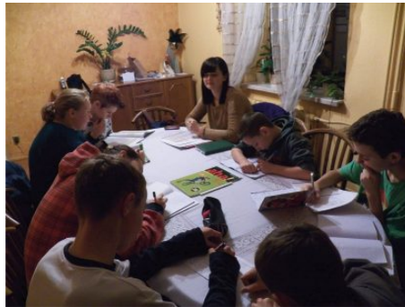
Kurs języka niemieckiego