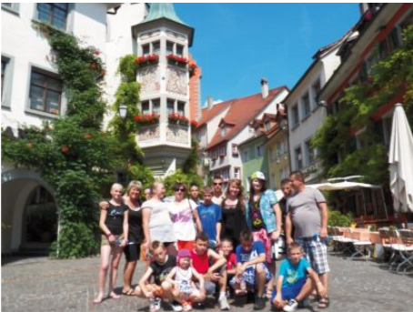
Wychowankowie Placówki Opiekuńczo-Wychowawczej podczas wycieczki w Friedrichshafen. Czerwiec, 2012 r.

W 2012 r. odbywały się również zajęcia terapeutyczne metodą Oryginal Play.