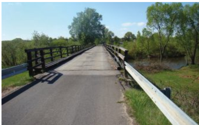
Most w Łęgu - przed realizacją