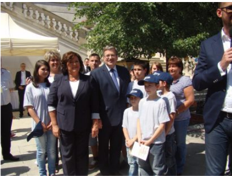
Wychowankowie Placówki Opiekuńczo-Wychowawczej z wizytą w Pałacu Prezydenckim.