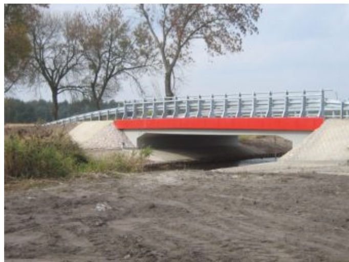
Most w Raczkowicach - po realizacji