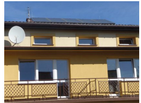
Dom dla Dzieci Skałka, 2011 r.

dzieci z Placówki zajęły I miejsce, a w konkursie zorganizowanym przez Firmę „Wawel” – „Zostań pomocnikiem Św. Mikołaja” wygrały 2 aparaty cyfrowe Samsung.