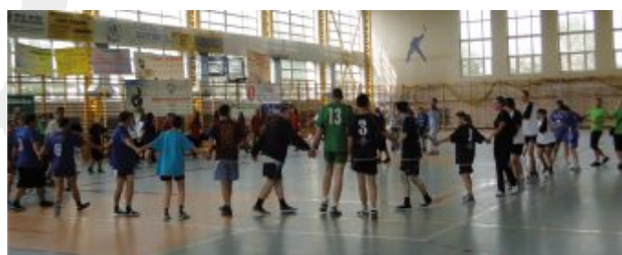
Wspólna zabawa na zakończenie turnieju