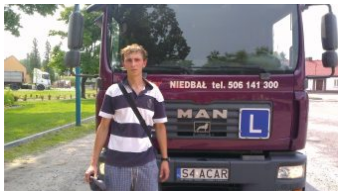
Uczestnik kursu zdający w trakcie egzaminu na prawo jazdy w ramach projektu „Mam zawód mam pracę w regionie”

Zgodnie z uchwałą Rady Powiatu w Częstochowie z dnia 29 listopada 2011r w sprawie szczegółowych warunków, form, zakresu oraz trybu udzielania pomocy w ramach „Lokalnego wspierania edukacji uzdolnionych uczniów szkół ponadgimnazjalnych prowadzonych przez powiat częstochowski” stypendia starosty częstochowskiego otrzymało łącznie 55 uczniów. W 2012 roku z pomocy stypendialnej skorzystało 10 uczniów szkół ponadgimnazjalnych dla których powiat jest organem prowadzącym, przeznaczono na ten cel 20 000,00 zł, natomiast w roku 2013 stypendium starosty częstochowskiego otrzymało 25 uczniów (wówczas powiat przeznaczył 30 000,00 zł). W roku bieżącym w budżecie powiatu zabezpieczono kwotę 30 000,00 zł, która została rozdysponowana pomiędzy 20 uczniów szczególnie uzdolnionych.