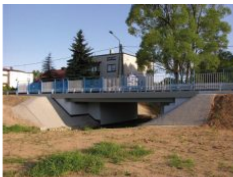
Most w Rudniku Wielkim