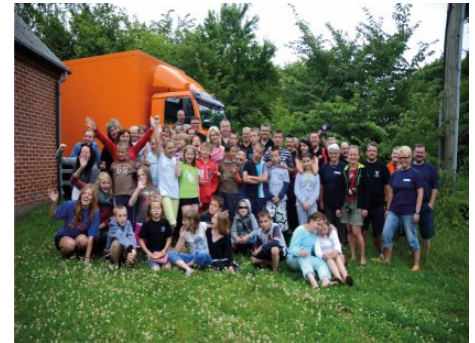
Wychowankowie Placówki Opiekuńczo-Wychowawczej na wakacjach w Danii.