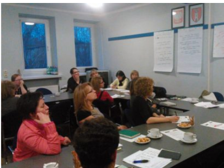
Spotkanie sieci współpracy i samokształcenia "Bezpieczeństwo w szkole" Starostwo Powiatowe, 27.03.2014 r. w projekcie „Doskonali pedagodzy drogą do sukcesu dzieci i młodzieży”.

W roku 2013 powiat częstochowski rozpoczął realizację projektu pn. „Doskonali pedagodzy drogą do sukcesu dzieci i młodzieży” Programu Operacyjnego Kapitał Ludzki, Priorytet III – Wysoka jakość systemu oświaty, który obejmuje swoim działaniem między innymi podniesienie jakości systemu kształcenia i doskonalenia nauczycieli. Jego głównym założeniem jest przede wszystkim prowadzenie szkoleń dla nauczycieli w ich macierzystych szkołach począwszy od przedszkoli do szkół ponadgimnazjalnych