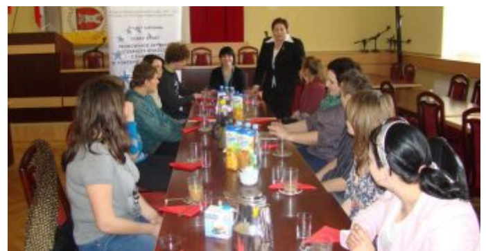
Spotkanie informacyjne dla uczestników i uczestniczek projektu.

Podczas spotkań przedstawiono sprawy związane z organizacją i realizacją projektu systemowego, omówiono formy wsparcia oferowane w ramach projektu, zapoznano uczestników i uczestniczki z regulaminem rekrutacji i uczestnictwa w projekcie oraz kryteriami kwalifikowalności.