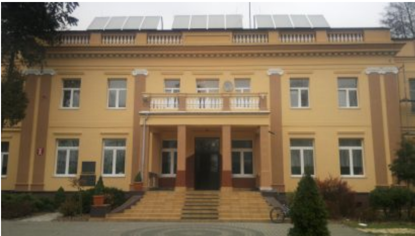
Kolektory słoneczne - Dom Dziecka w Chorzenicach