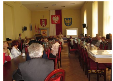
Konferencja z dyrektorami szkół i przedszkoli uczestniczących w projekcie - Starostwo Powiatowe, 28.05.2014 r. w projekcie „Doskonali pedagodzy drogą do sukcesu dzieci i młodzieży”.