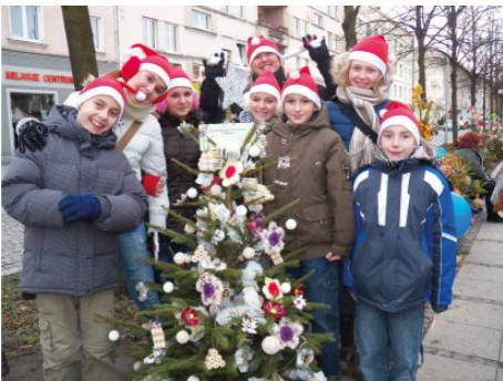
Konkurs na „Najpiękniejszą choinkę”.