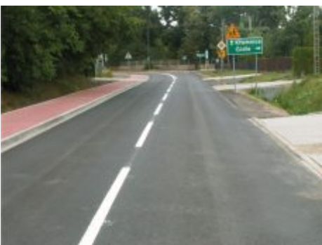
Przebudowa drogi w Garnku