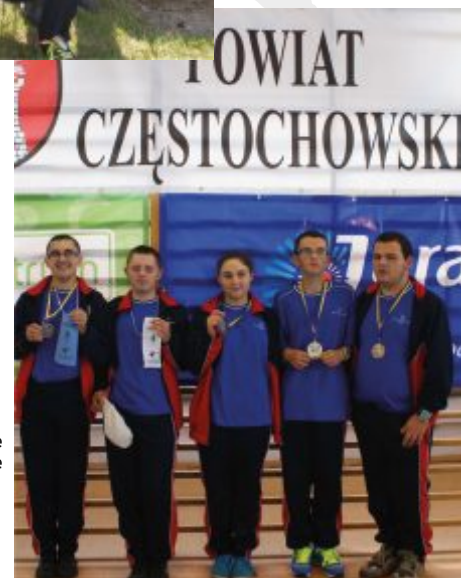
Wychowankowie SOSW Bogumiłke