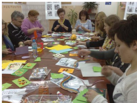
Spotkanie sieci współpracy i samokształcenia "Promocja i budowanie wizerunku szkoły" - Zespół Szkół we Wrzosowej, 11.04.2014 r. w projekcie „Doskonali pedagodzy drogą do sukcesu dzieci i młodzieży”.