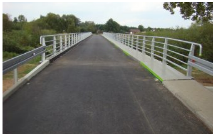
Most w Łęgu - po realizacji