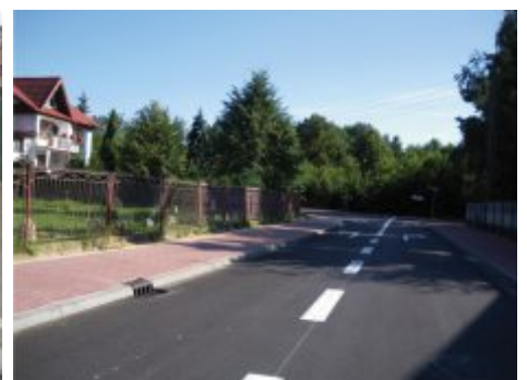
Przebudowa ul. Pocztovej w Błachowni