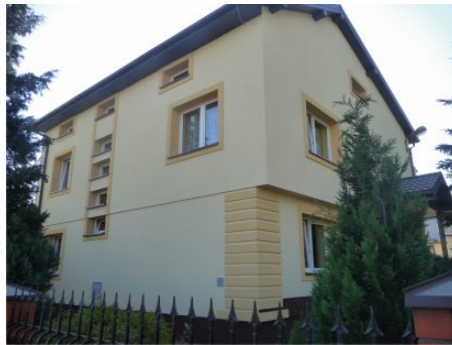
Dom dla Dzieci Skałka, 2011 r.