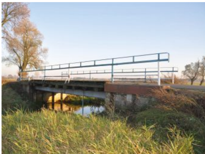
Most w Raczkowicach - przed realizacją

Powiat częstochowski był liderem projektu, na nim spoczywała odpowiedzialność za prawidłową realizację, wdrożenie i rozliczenie przedsięwzięcia. Koszt całkowity projektu wyniósł 4,1 mln zł, w tym dofinansowanie 3,3 mln zł. Wkład własny w wysokości wynikającej z udziału w projekcie pokrywały gmin i powiat. Część projektu przypadająca na