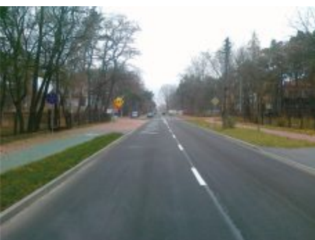
Przebudowa drogi w Olsztynie - projekt partnerski