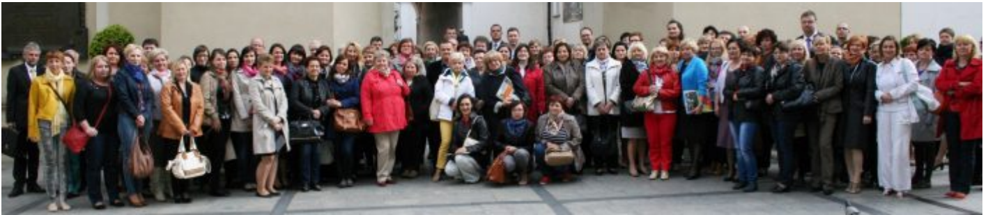
XIV Ogólnopolska Konferencja Pracowników Socjalnych, Częstochowa 16-18 czerwca 2014 r.

W konferencji uczestniczą przedstawiciele kilkudziesięciu jednostek pomocy społecznej z terenu Polski, ale również, z czego należy się cieszyć, reprezentanci sektora pozarządowego.