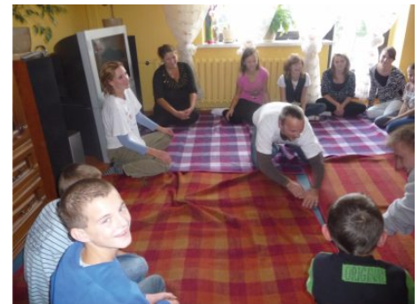
Zajęcia terapeutyczne metodą Oryginal Play.

Powiatowe Centrum Pomocy Rodzinie w Częstochowie