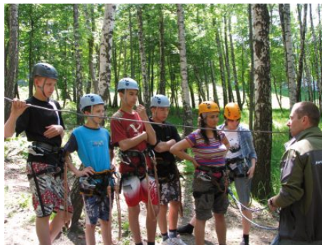
Wychowankowie Placówki Opiekuńczo-Wychowawczej w Ogrodzieńcu.