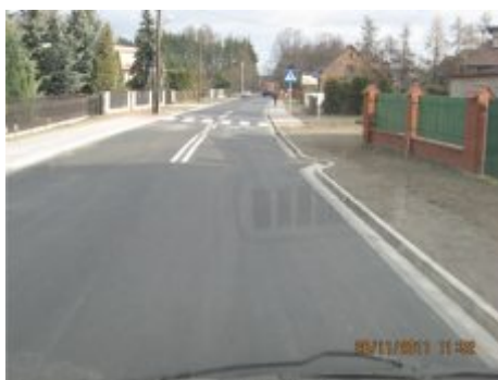
Przebudowa drogi w Rybniej - projekt partnerski