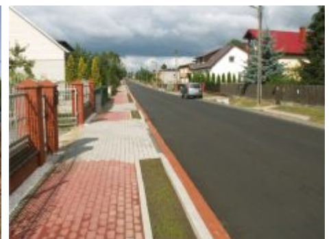
Przebudowa drogi Mykanów ul. Kościuszki