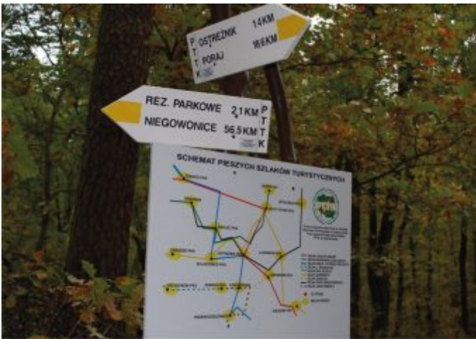
Szlak „Zamonitu”, drogowaskazy i tablica mocowane na rogaczu w Złotym Potoku.

Gór Gorzkowskich pieszy w Apolonie (skrzyżowanie szlaków); Szlak Olsztyński pieszy, Częstochowa - Kręciwilk o długości 6,6 km; Szlak Warowni Jurajskich pieszy, Mstów - Turów o dł. 8,0 km; Szlak „Olsztyński” rowerowy, Częstochowa - Śmiertny Dąb o dł. 48,9 km; Szlak „Jury Wieluńskiej” pieszy, Częstochowa - Kruszyna o dł. 34,4 km; Szlak im. Barbary Rychlik pieszy, Korwinów - Biskupice Kąty na dł. 19,4 km; Wydatkowano łącznie 17300 zł.