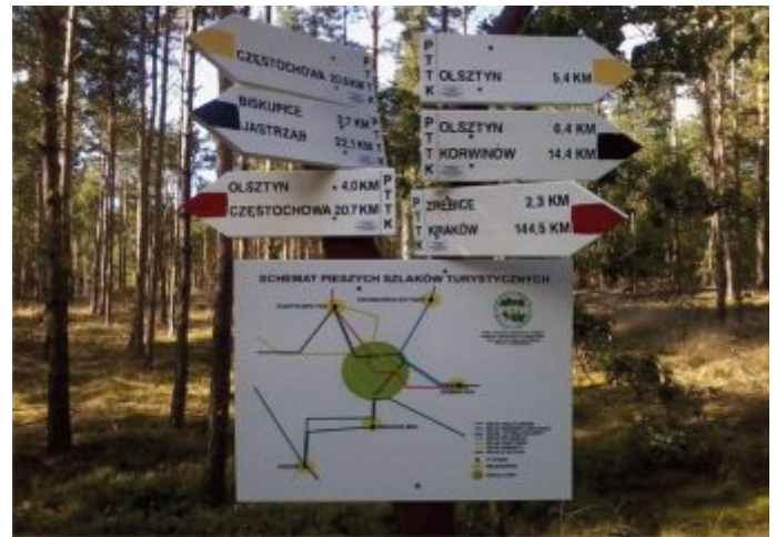
Węzeł szlaków w Sokolich Górach