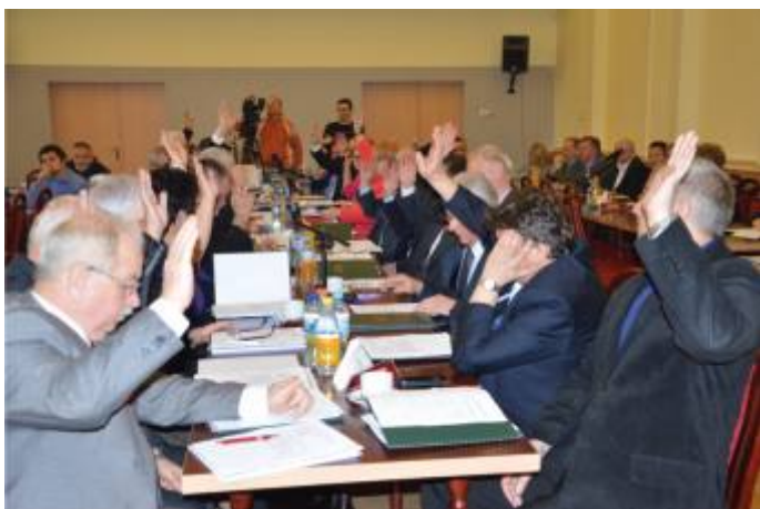
Radni jednogłośnie zgodzili się podzielić sesję na dwie części