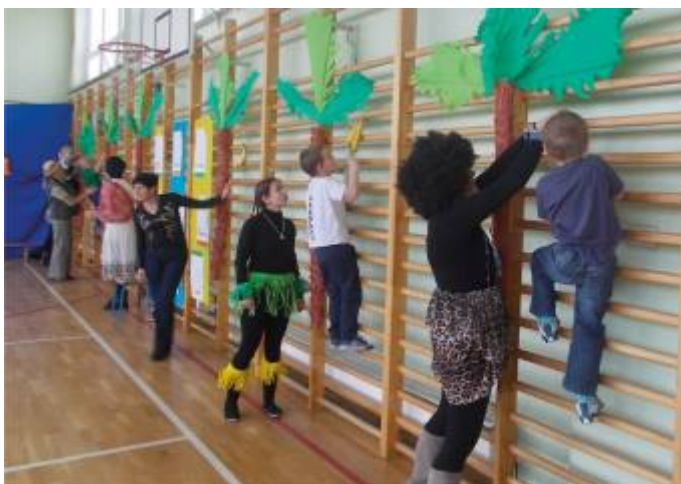
Zrywanie bananów z palmy