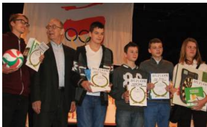
Laureaci w kat. szkoły gimnazjalne