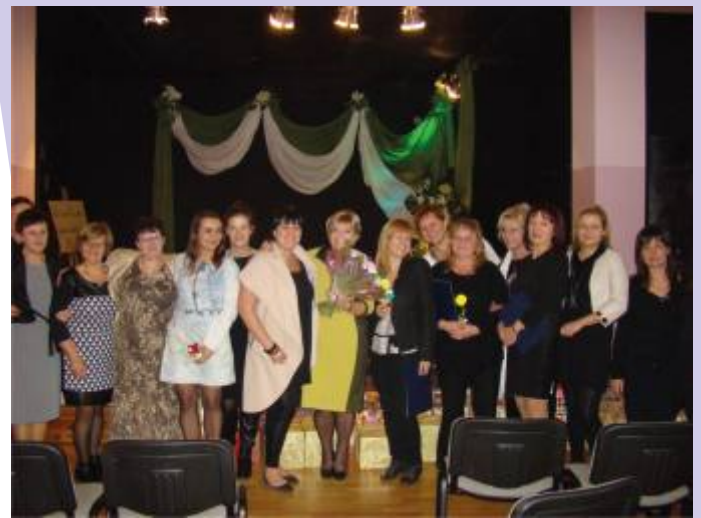
Goście i gospodarze upamiętnili jubileusz wspólnym zdjęciem