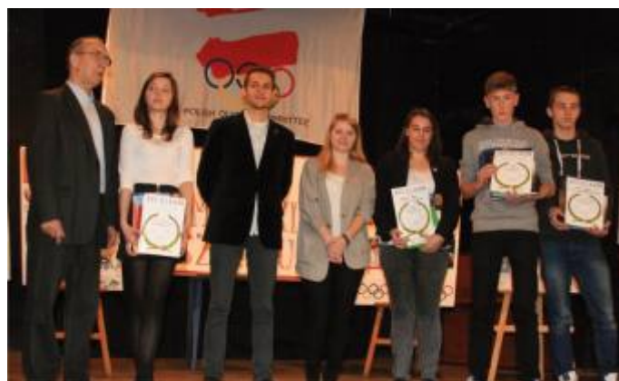
Laureaci w kat. szkoły ponadgimnazjalne

Organizatorami konkursu byli: Regionalna Rada PKOl w Częstochowie, Starostwo Powiatowe w Częstochowie, Urząd Miasta Częstochowy, Samorządowy Ośrodek Doskonalenia w Częstochowie i IV LO im. H. Sienkiewicza w Częstochowie.