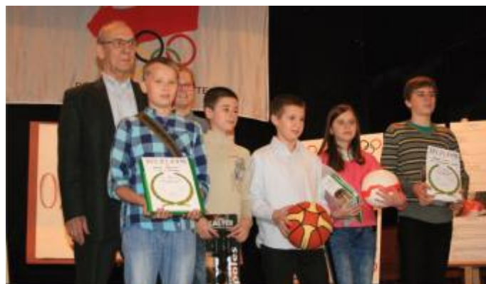
Laureaci w kat. szkoły podstawowe

W tej kategorii do zdobycia było maksymalnie 64 punkty.