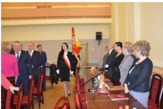
Wprowadzeniem sztandaru i odśpiewaniem hymnu państwowego rozpoczęła się I sesja Rady Powiatu V kadencji