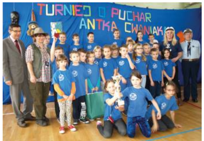
Zwycięska Gromada Zuchowa z organizatorami