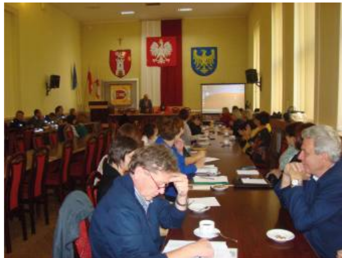
Narada w częstochowskim starostwie

Spotkanie było również okazją do dyskusji pomiędzy przedstawicielami policji i ośrodków pomocy społecznej na temat realizacji procedury Niebieska Karta.