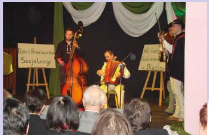
Występ kapeli góralskiej „Hora” ze Szczyrku