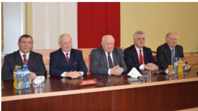
Nowy Zarząd Powiatu