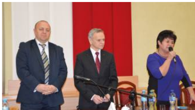
Przewodniczący (w środku) i wiceprzewodniczący Rady Powiatu