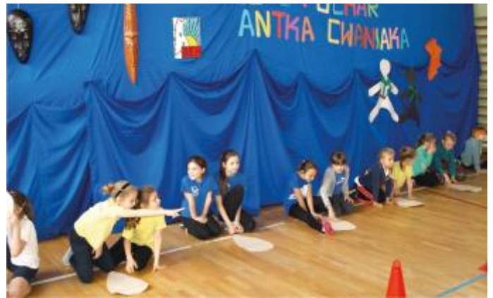
Przygotowania do malowania masek