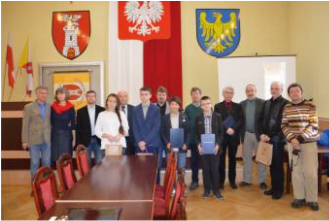
Laureaci konkursu z przedstawicielami władz powiatu