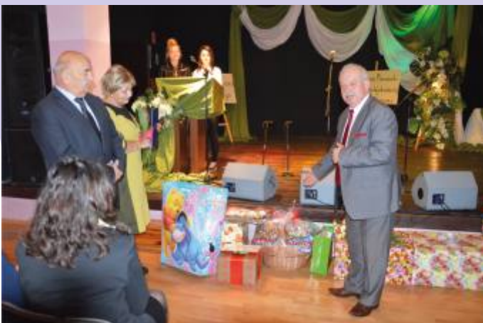
Przedstawiciele władz powiatu przybyli z licznymi prezentami