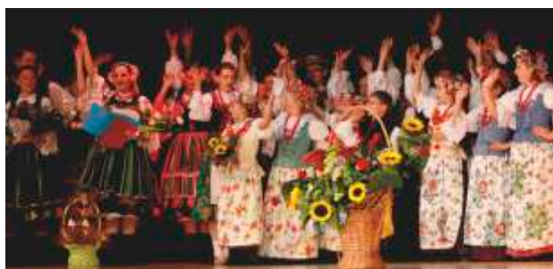
Jubileusz 40-lecia zespołu