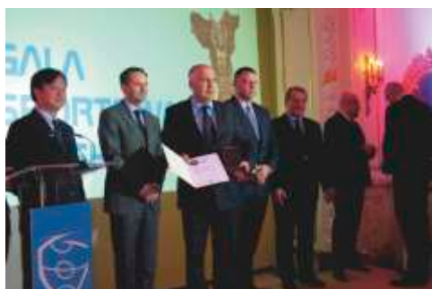
„Inwestor na Medal” – Warszawa, listopad 2013 r.