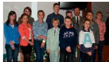
Uroczyste wręczenie nagród w konkursie fotograficznym organizowanym przez Nadleśnictwo Koniecpol - „Las wokół nas”