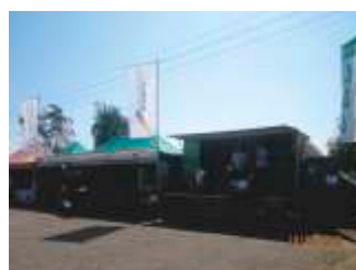
Wystawa z oferowanymi produktami podczas święta Ciulimu-Czulentu w Lelowie