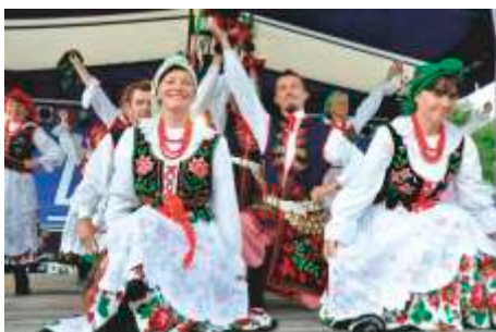
Święto Pstrąga w Złotym Potoku 6.08.2011r