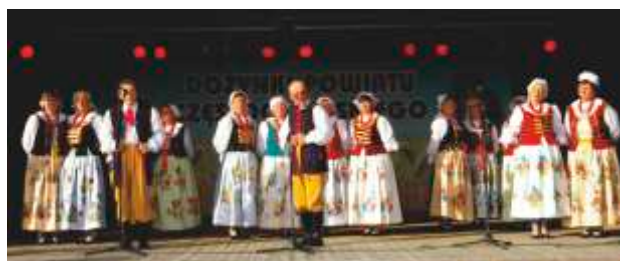
Dożynki Powiatu Częstochowskiego w Piasku 21.08.2011r