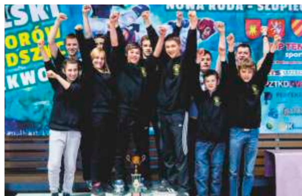
KS Dragon - Mistrzostwa Polski Juniorów Młodszych w Nowej Rudzkiej