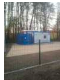
Wykonana w 2014 roku inwestycja „Odbudowa przepompowni wody w miejscowości Ślęzany” – inwestycja realizowana dla Gminy Lelów