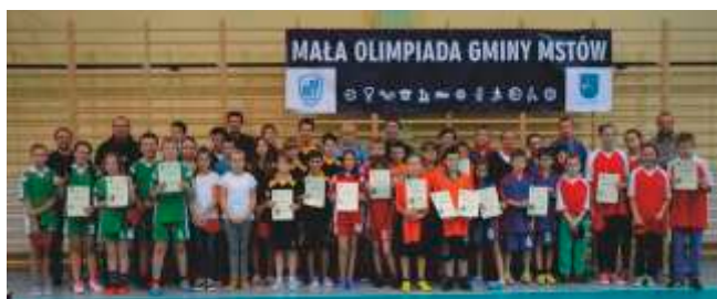
Mała Olimpiada Gminy Mstów

Jego wieloletnia działalność społeczna i zaangażowanie na rzecz rozwoju sportu i turystyki zaowocowała w 2014 r. zwycięstwem w wyborach samorządowych - został Wójtem Gminy Mstów.