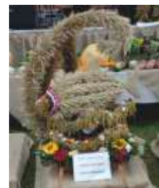
Wieniec wykonany przez zespół na dożynki powiatowe