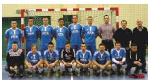
II ligowa drużyna futsalu WLKS Kmicic