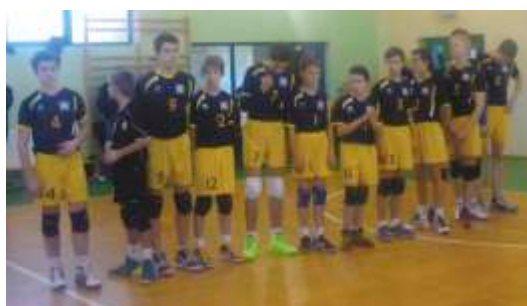
Drużyna młodzików LKPS Borowno