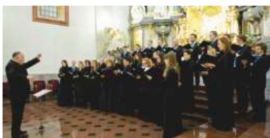
Koncert na Jasnej Górze, XVI Święto Muzyki