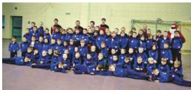
UKS Orzeł w pełnej krasie

W 2014 r. był organizatorem Ogólnopolskiego Turnieju Piłki Nożnej „Deichmann”. Przez 8 tygodni na obiektach sportowych w Konopiskach rywalizowało ponad 300 dzieci w wieku 6-11 lat.