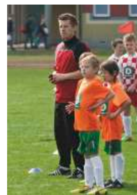
Trener podczas meczu