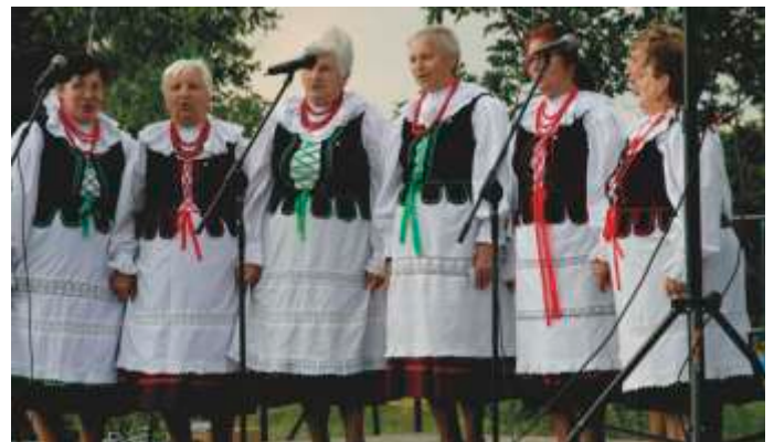
Występ zespołu na festynie żniwnym w Lubojnie