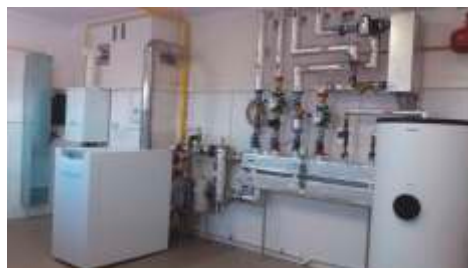
Kotłownia gazowa o mocy 175kW – w budynku Hurtowni farmaceutycznej NEXTER w Przyszowicach, wraz z instalacjami: a. instalacje centralnego ogrzewania, b. instalacje wodno-kanalizacyjne, c. sieci zewnętrzne – instalacja wody deszczowej, instalacja kanalizacji sanitarnej, przyłącze gazu, przyłącze wody.