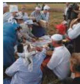
Poczęstunek przygotowany przez zespół na festynie żniwnym