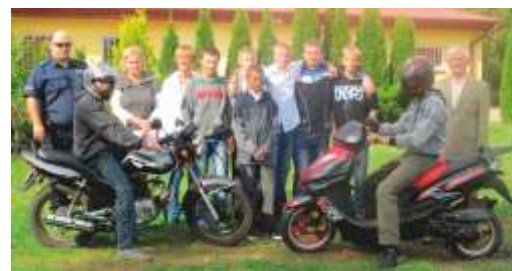
Egzamin na kartę motorowerową