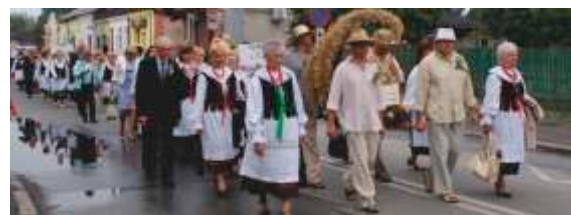
Zespół na dożynkach powiatowych w Kłomnicach