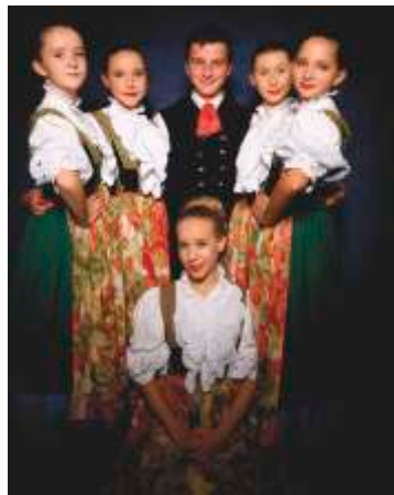
Zespół prowadzi wymianę z grupami zagranicznymi

Zespół Folklorystyczny „Kamienica” powstał w 1970 roku jako zespół śpiewaczy przy Spółdzielni Tkaczy i Dziewiarzy w Kamienicy Polskiej z inicjatywy Tadeusza Sędziwego.