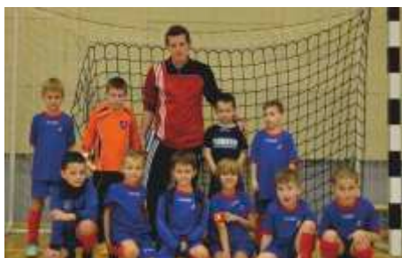
Trener ze swoimi orzełkami