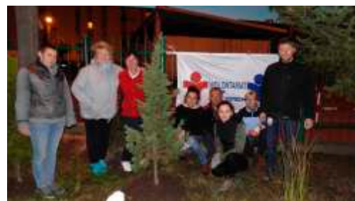
Współpraca z Fundacją Cemex