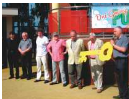
Artystyczne Lato w Poczesnej – Dni Gminy Poczesna, czerwiec 2013 r.