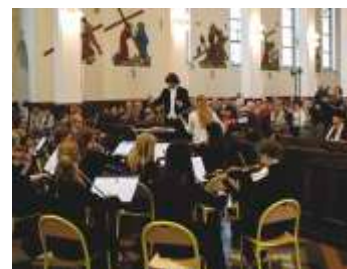
Koncert w Garnku