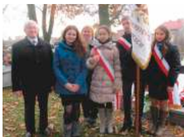
11 listopada 2012 r.