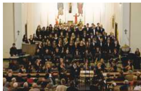
Koncert w Garnku (gm. Kłomnice) 2014

Święto Muzyki to kolejna cykliczna impreza organizowana przez Stowarzyszenie w Częstochowie i w miejscowościach z terenu powiatu częstochowskiego: Garnku, Borownie, Mstowie. W roku 2014 wspólnie z Powiatem Częstochowskim było współorganizatorem XIV Międzynarodowego Festiwalu Muzyki Sakralnej „Gaude Mater”. W 2014 roku Stowarzyszenie Przyjaciół „Gaude Mater” obchodziło Jubileusz 15 lecia swojej działalności, z tej okazji Minister Kultury i Dziedzictwa Narodowego prof. Małgorzata Omilanowska przyznała nagrodę specjalną „w uznaniu nieocenionych zasług wszystkich członków Stowarzyszenia dla kultury polskiej”.