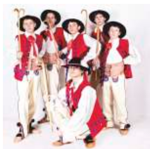
Zespół reprezentuje region częstochowski na festiwalach międzynarodowych

W roku bieżącym „Kamienica” obchodzi 45-lecie swojej działalności.