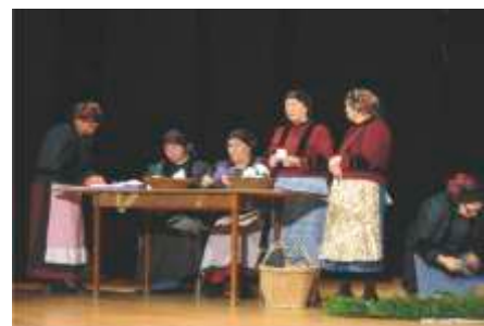
Dla podkreślenia regionalizmu członkowie występują w strojach z poprzedniego stulecia