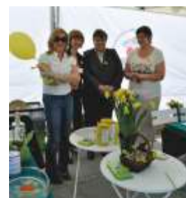
Kampania Poła Nadziei 2014