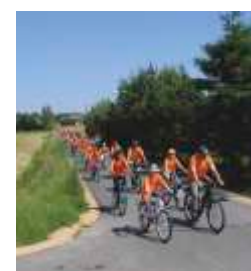
VIII Rodzinny Rajd Rowerowy Rudniki 2014