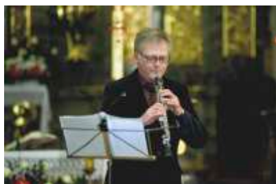
Koncert w Mstowie, XVI Święto Muzyki