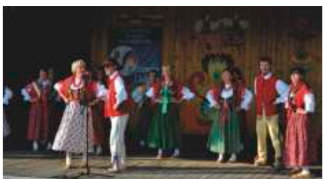
Folkloriada ROK z daleka i bliska, Piasek 7.07.2012r

nie może zabraknąć również na przeglądach i konkursach. Do najważniejszych sukcesów można zaliczyć: II miejsce w 2014 r. na Ogólnopolskiej Folkloriadzie organizowanej w gminie Poraj, I miejsce w kategorii Zespołów Śpiewaczych w przeglądzie Zespołów i Kapel Ludowych w Świętochłowicach w 2011 r. W październiku 2014 r. Zespół Janowianie uzyskał Certyfikat Częstochowskiej Organizacji Turystycznej jako jeden z najlepszych produktów turystycznych, który krzewi kulturę ludową i promuje region częstochowski.