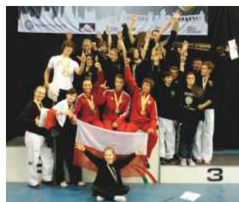
KS Dragon Puchar Europy w Budapeszcie 10-12. 10. 2015