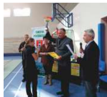
Dni Olimpijczyka, zorganizowane w Poczesnej