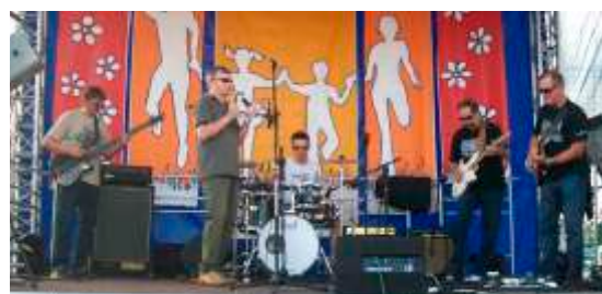
Występ z zespołem Hasterband