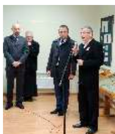
Wystąpienie na otwarciu Muzeum Regionalnego 11 listopada 2012r.