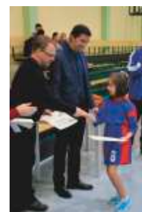
Wręczenie dyplomów na Małej Olimpiadzie