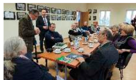
Wystąpienie na spotkaniu w muzeum