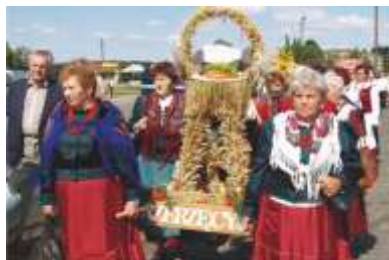
Grusza czynnie uczestniczy w życiu społecznym gminy i powiatu