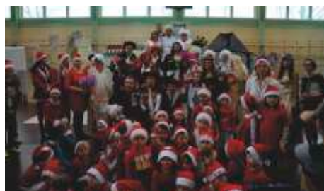
Mikolajki Zespół Szkół w Mstowie