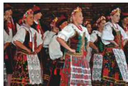
Kamienica posiada w swoim repertuarze tańce regionalne oraz narodowe