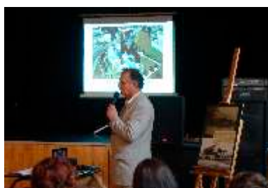
Seminarium animatorów w Mykanowie