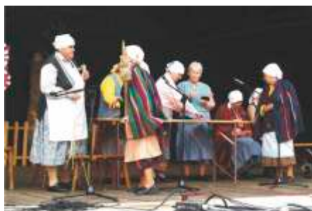
Obrzędy są oparte na prawdziwych wydarzeniach mających miejsce w Rzeręczycach