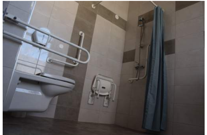
Chirurgia ogólna-prysznic dla niepełnosprawnych