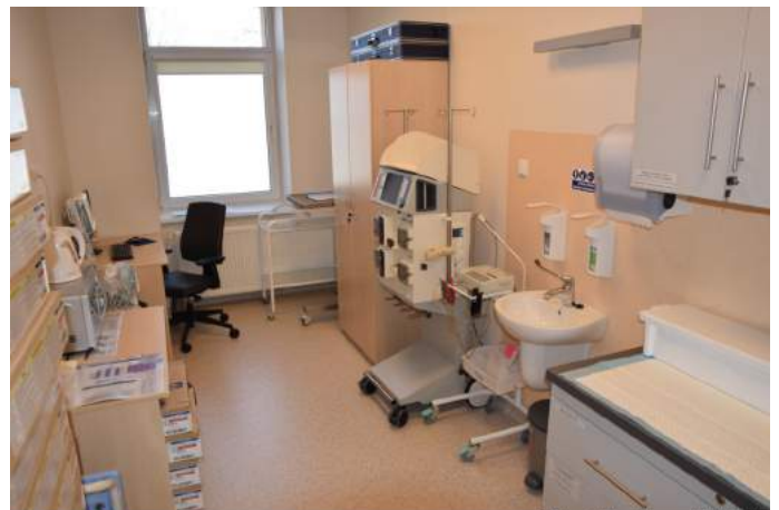
Gabinet lekarski na oddziale AiT