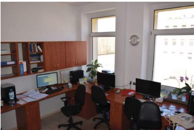
Gabinet lekarski na chirurgii ogólnej