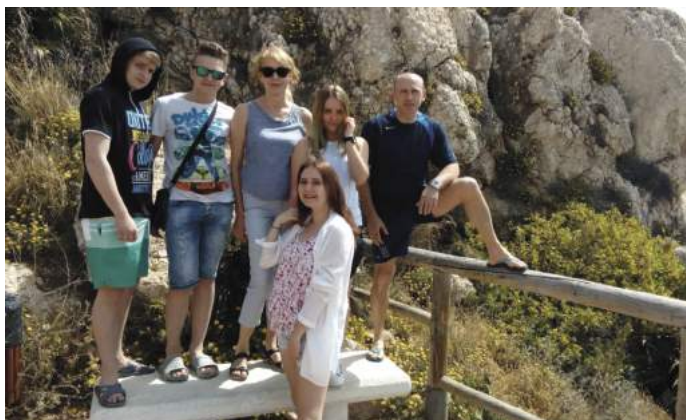
Wycieczka krajoznawcza podczas pobytu grupy uczniów w Hiszpanii