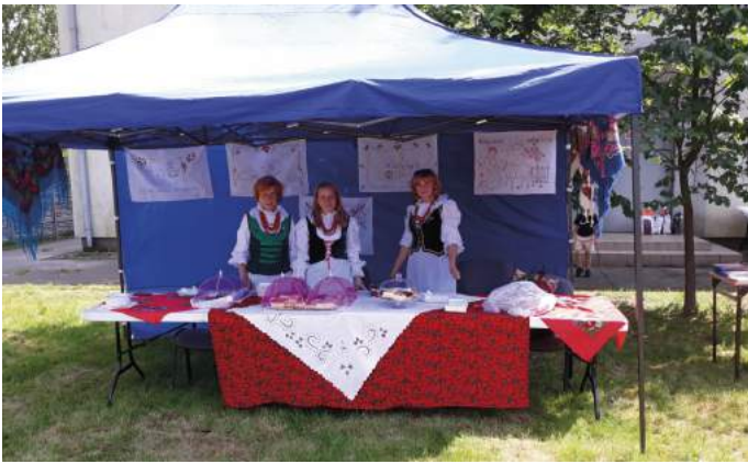
Koło Gospodyń Wiejskich z Olsztyna