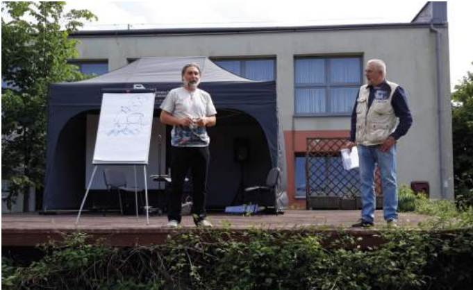
Pojedynek na słowa i rysunki