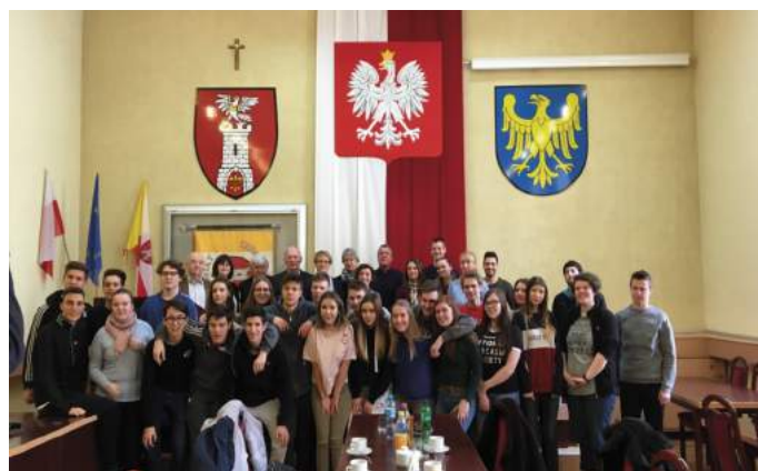
Spotkanie z Zarządem Powiatu Częstochowskiego podczas wizyty partnerów projektu Innowacyjne Pokolenie w Kamienicy Polskiej