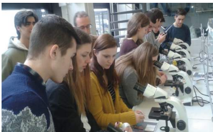
Zajęcia laboratoryjne na Uniwersytecie Nauki i Techniki w Ghent w Belgii podczas pobytu w KAZ Atheneum Zottegem w ramach realizacji europejskiego projektu edukacyjnego „Innovative Generation”