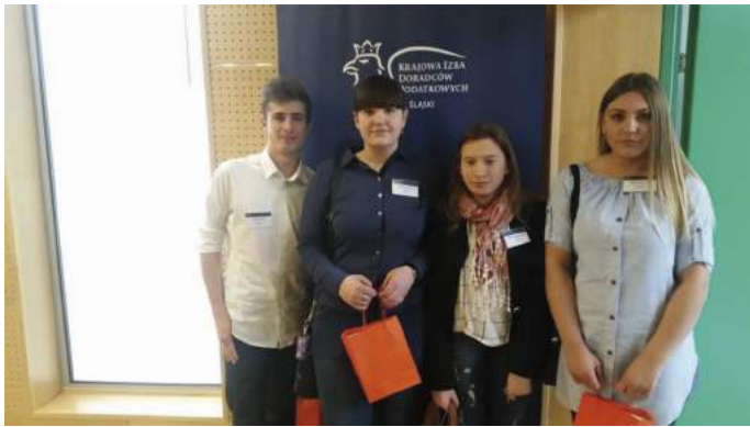
Konkurs wiedzy o podatkach