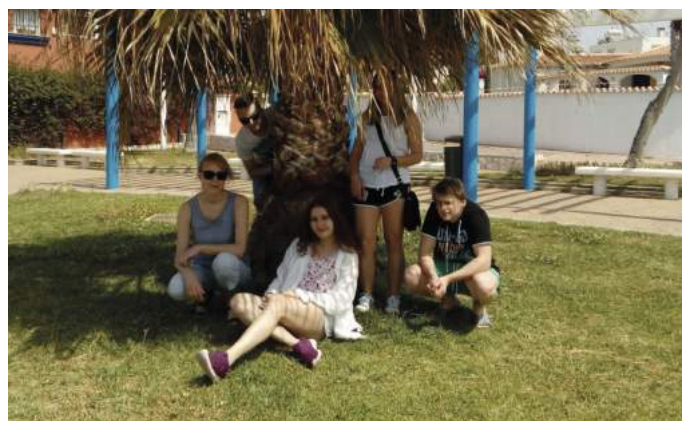
Uczniowie naszego Liceum podczas wizyty studyjnej w Hiszpanii – Rincón de la Victoria w dniach 24 - 28 kwietnia 2017r.