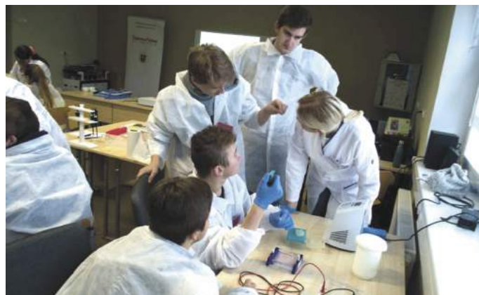
Zajęcia w laboratorium Uniwersytetu Wileńskiego podczas wizyty w partnerskiej szkole w Moletu na Litwie w dniach 9 - 13 października 2017r

odwiedzili Centrum Nauki i Techniki w Łodzi. Zorganizowaliśmy również wycieczki do Krakowa i Oświęcimia. Podczas wyjazdu do Częstochowy odbyło się także spotkanie z Zarządem Powiatu Częstochowskiego, podczas którego młodzież zapoznała się ze strukturą funkcjonowania organu prowadzącego naszą szkołę.