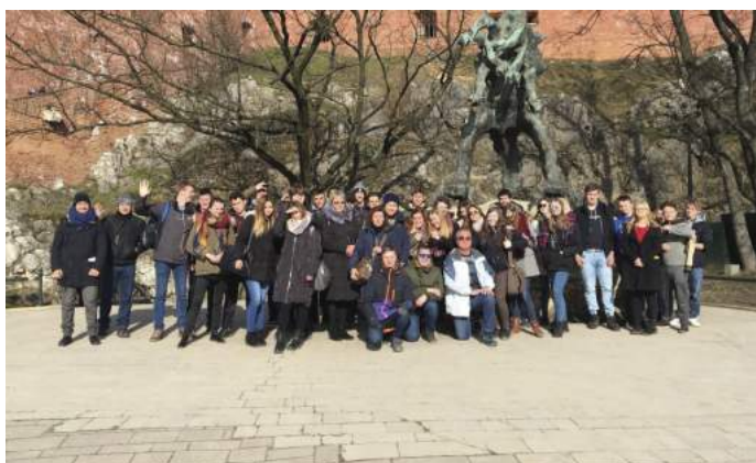
Zwiedzanie Krakowa podczas wizyty partnerów projektu Innowacyjne Pokolenie w Kamienicy Polskiej w dniach 19 - 23 marca 2018r.