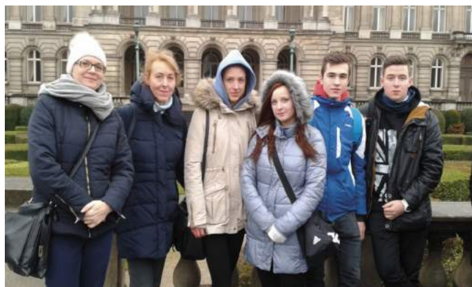
Pobyt w KAZ Atheneum Zottegem w Belgii, w ramach realizacji europejskiego projektu Innovative Generation” od 6 do 10 lutego 2017r.

Od 1 września 2016r. Liceum Ogólnokształcące w Kamienicy Polskiej realizuje projekt „Innowacyjne pokolenie”, będący częścią programu Erasmus+ Akcja 2 WSPÓŁPRACA NA RZECZ INNOWACJI I WYMIANY DOBRZYCH PRAKTYK. Podstawowym celem projektu jest zwiększenie zainteresowania uczniów nauką przedmiotów ścisłych i techniką, poprzez promowanie innowacyjnych metod