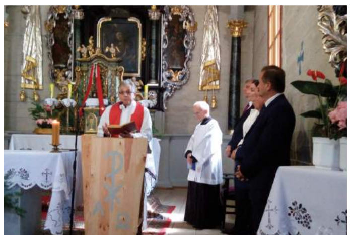
Nabożeństwo w kościele Św. Marii Magdaleny