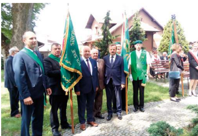
Delegacje wraz z pocztami sztandarowymi