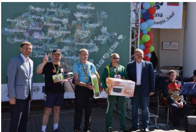
Najlepsi seniorzy biegu