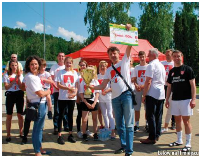
Lelów na II miejscu

Po zakończeniu wszystkich konkurencji i podliczeniu zebranych przez reprezentacje gmin punktów okazało się, że w klasyfikacji generalnej zwyciężyła – co było dużą niespodzianką - gmina Koniecpol – 134,7 pkt przed Lelowem – 107,5 pkt i Poczesną – 97,2 pkt.