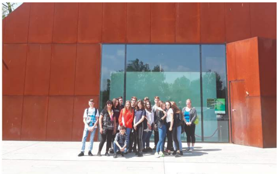
Grupa przed Muzeum w Markowej