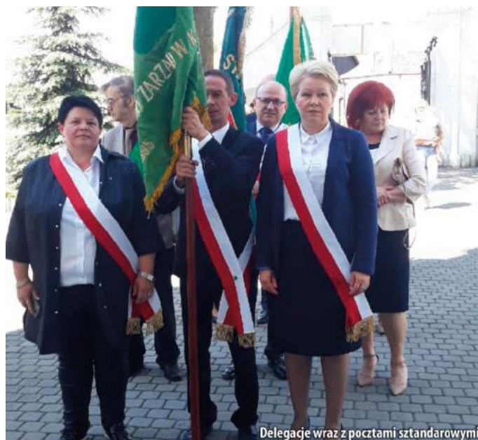
Delegacje wraz z pocztami sztandarowymi