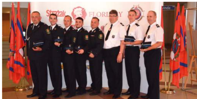
Delegacje z OSP Stary Kocin i OSP Mykanów