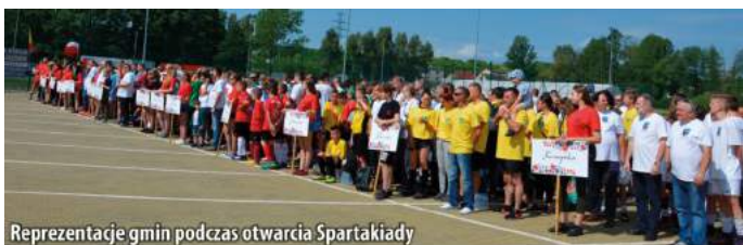
Reprezentacje gmin podczas otwarcia Spartakiady

Reprezentacje 14 gmin powiatu częstochowskiego przyjechały 26 maja br. do Mstowa, by na Stadionie LKS „Warta” rywalizować w 15 konkurencjach III Spartakiady Gmin Powiatu Częstochowskiego. Impreza została zorganizowana przez Powiatowe Zrzeszenie LZS, Starostwo Powiatowe w Częstochowie i Urząd Gminy Mstów przy finansowym wsparciu Śląskiego Wojewódzkiego Zrzeszenia LZS w Katowicach.