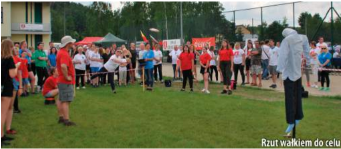
Rzut wałkiem do celu