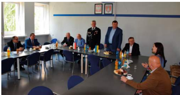
Spotkanie delegacji ukraińskiej z Zarządem Powiatu

gminy będą chcieli należeć. Ci którzy nie zdecydują sami zostaną włączeni do jednej z gmin decyzją administracyjną. Reforma zmieni także funkcjonowanie ukraińskich powiatów. Obecny powiat śniatyński przestanie istnieć i będzie włączony do powiatu kołomyjskiego. Ukraińscy goście zwiedzili także klasztor na Jasnej Górze i mogli przejechać się po Częstochowie autobusem turystycznym tzw. „londyńczykiem”. Po południu do Złotego Potoku przyjechała druga część delegacji, która wzięła udział w III Powiatowej Spartakiadzie Gmin Powiatu Częstochowskiego.