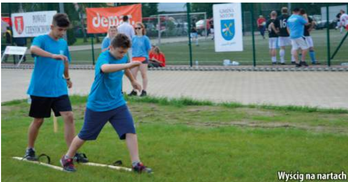
Wyścig na nartach