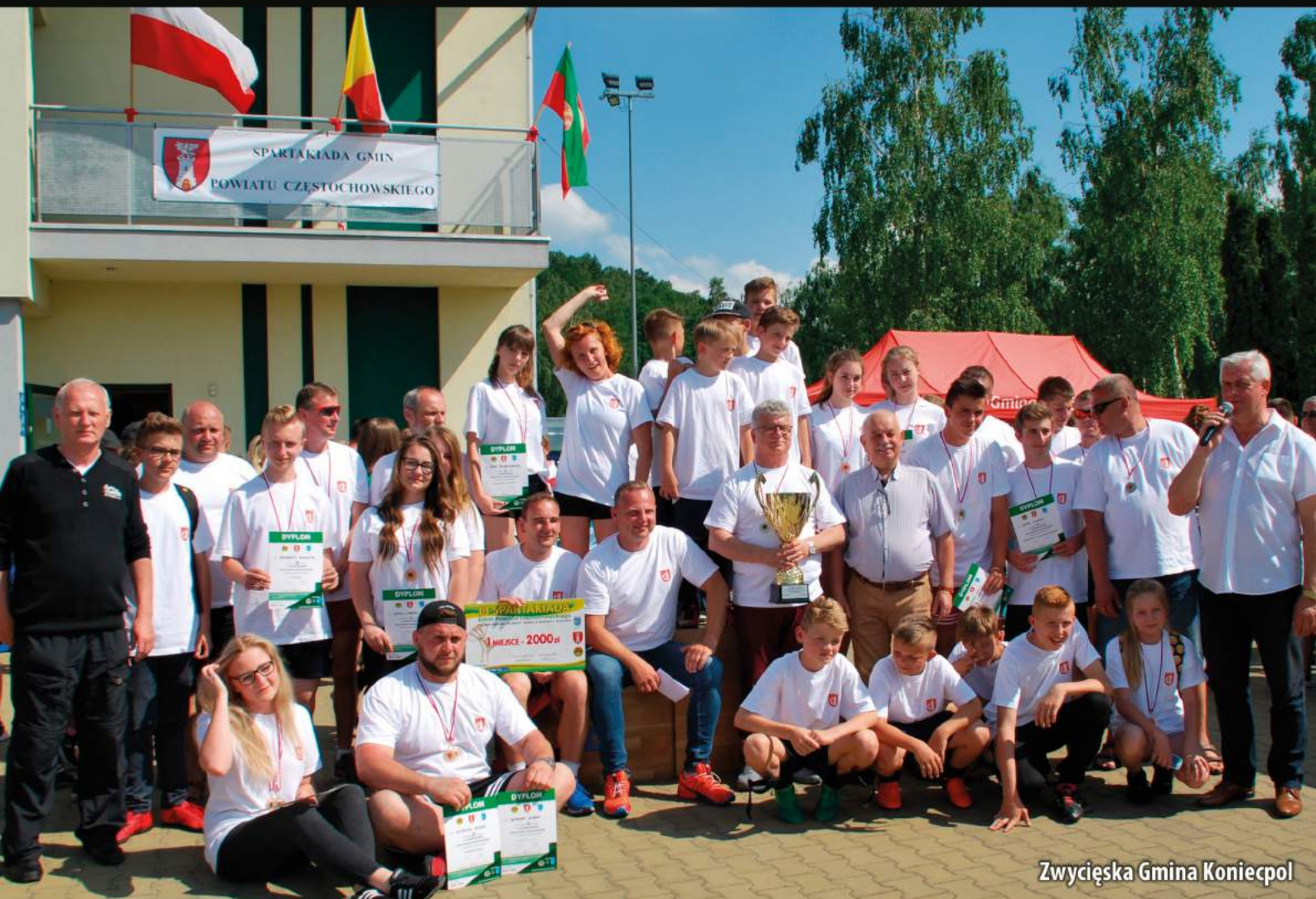
Zwycięska Gmina Koniecpol

BEZPŁATNY BIULETYN INFORMACYJNY STAROSTWA POWIATOWEGO W CZĘSTOCHOWIE