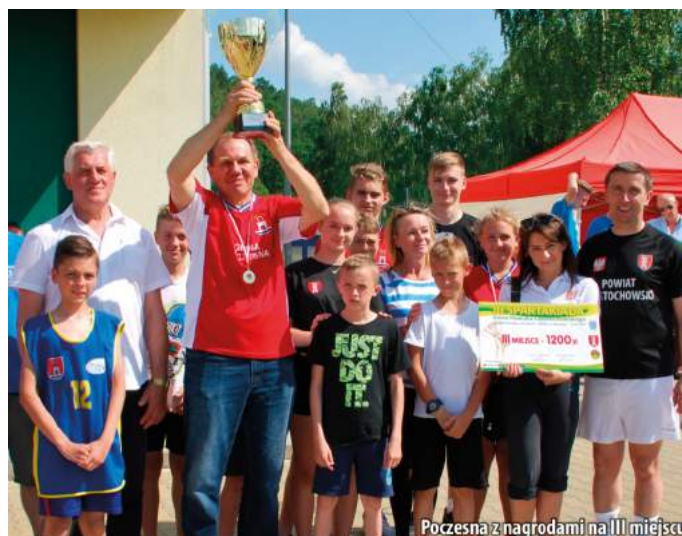
Poczesna z nagrodami na III miejscu