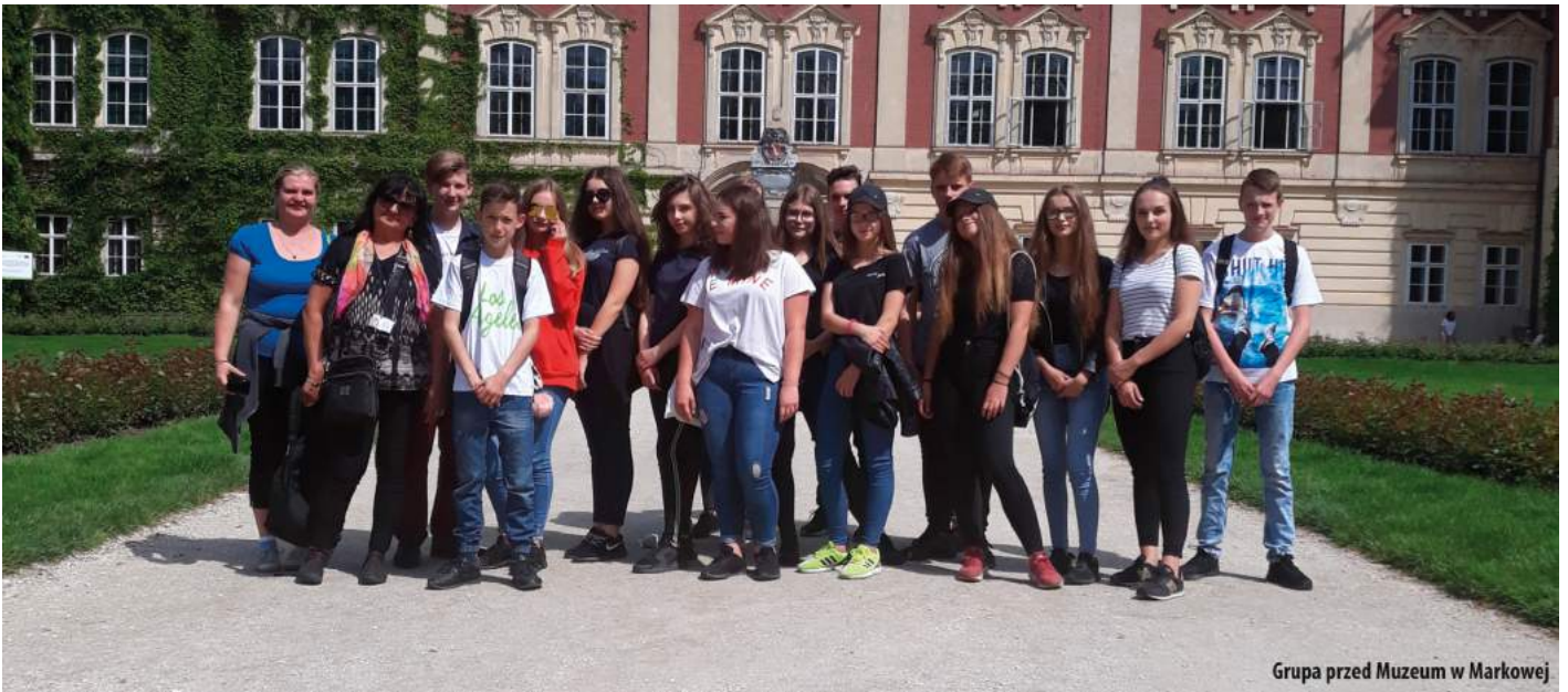
Grupa przed Muzeum w Markowej

lekarstwa, niosąc nadzieję wszystkim potrzebującym - bez względu na wyznanie czy narodowość. Uczestnicy naszego projektu wystąpili w charakterze „szkolnych przewodników”, przybliżając kolegom temat wystawy.