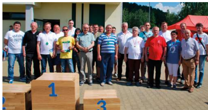
Ukraina na Spartakiadzie