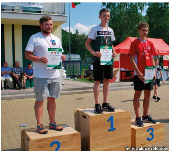
Tenis stołowy chłopców