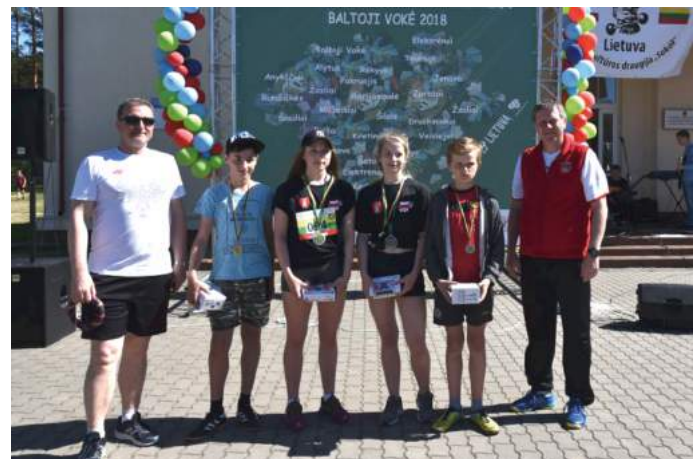
Wicemistrzowie Turnieju Ringo