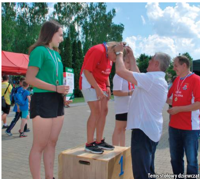
Tenis stołowy dziewcząt

Po zakończeniu wszystkich konkurencji i podliczeniu zebranych przez reprezentacje gmin punktów okazało się, że w klasyfikacji generalnej zwyciężyła – co było dużą niespodzianką - gmina Koniecpol – 134,7 pkt przed Lelowem – 107,5 pkt i Poczesną – 97,2 pkt.