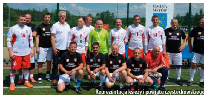
Reprezentacja księży i powiatu częstochowskiego

Natomiast w meczu piłki siatkowej lepsza okazała się drużyna Powiatu Częstochowskiego pokonując samorządowców ze Śniatynia 2:0.