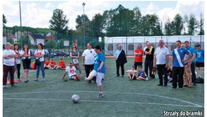
Strzały do bramki