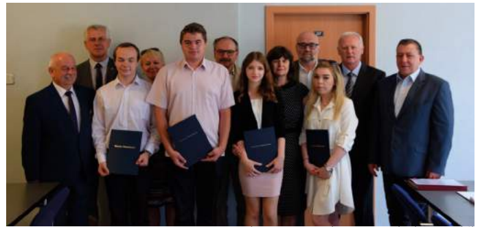
Laureaci stypendium wraz z Zarządem Powiatu i dyrektorami szkół