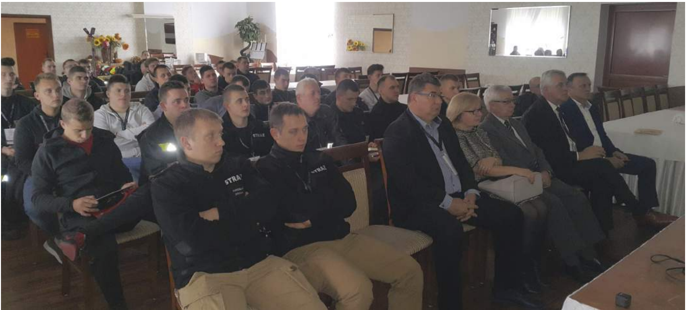
Zaproszeni goście z uczestnikami warsztatów