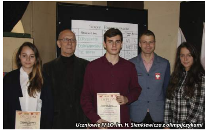
Uczniowie IV LO im. H. Sienkiewicza z olimpijczykami