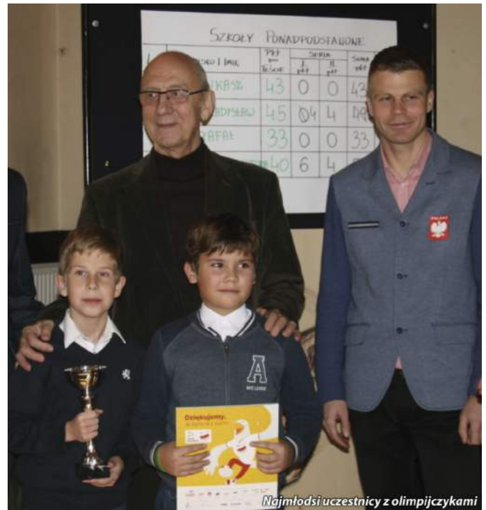
Najmłodsi uczestnicy z olimpijczykami