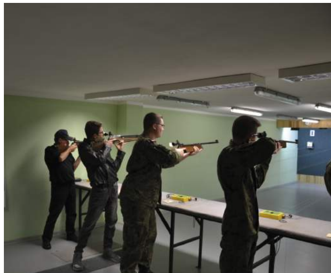
Zawodnicy na stanowiskach strzeleckich

Wszyscy uczestnicy memoriału zostali obdarowani upominkami, zaś najlepszym wręczono puchary i bony upominkowe ufundowane przez Starostwo Powiatowe w Częstochowie i Regionalną Radę PKOL w Częstochowie. Gmina Kłomnice i Stowarzyszenie na Rzecz Rozwoju Gminy Kłomnice zadbały o stronę organizacyjną przygotowując strzelnicę i karabiny oraz poczęstunek.