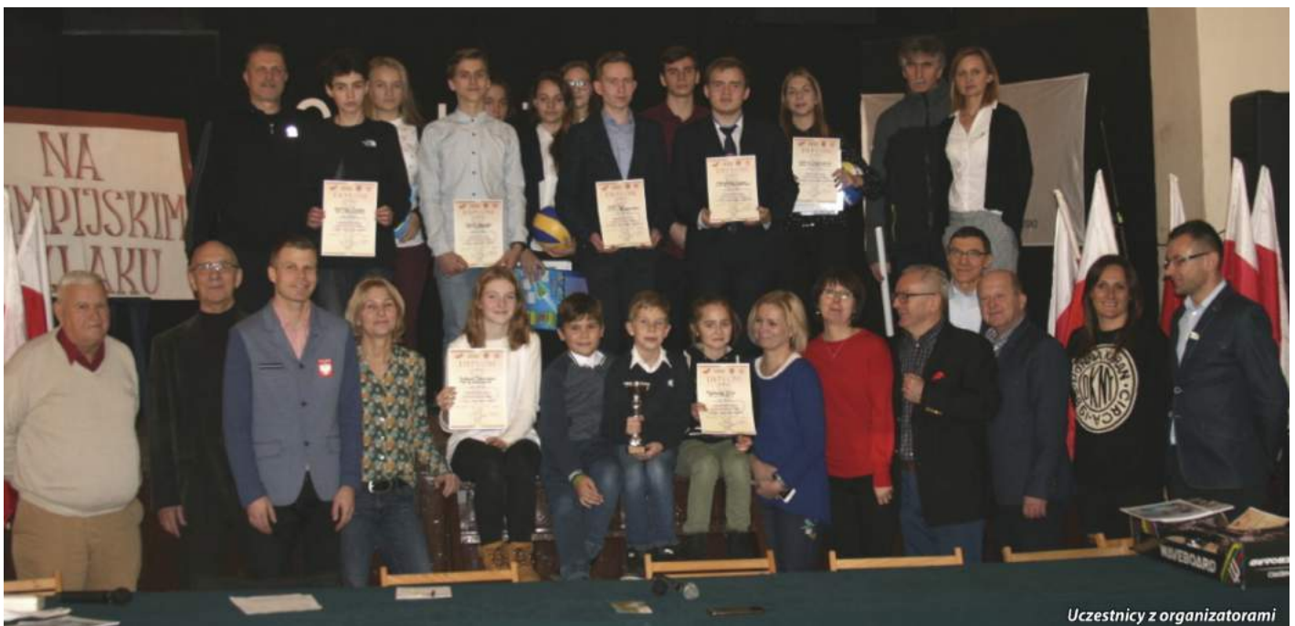
Uczestnicy z organizatorami