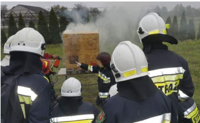
Jeden z pokazów