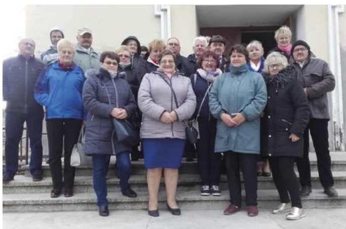
Dzień Białej Laski 27.10.2018

Pierwsze próby organizowania się niewidomych w Polsce przypadają na połowę XIX wieku, kiedy to w Warszawie powstało Stowarzyszenie Niewidomych