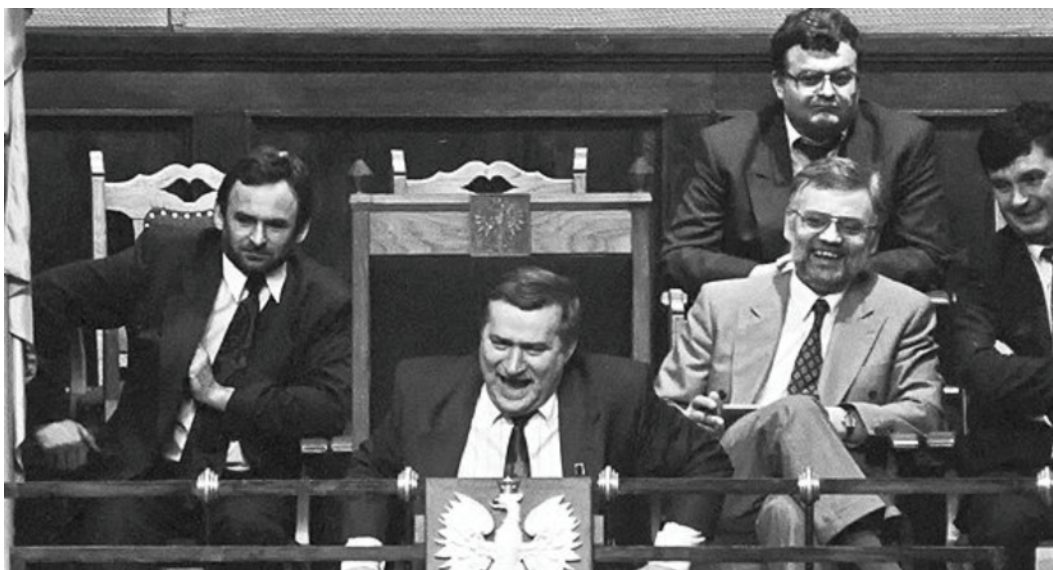
Na zdjęciu m.in. Prezydent Lech Wałęsa w chwili uchwalenia wotum nieufności dla rządu Jana Olszewskiego 4/5 czerwca 1992 roku.