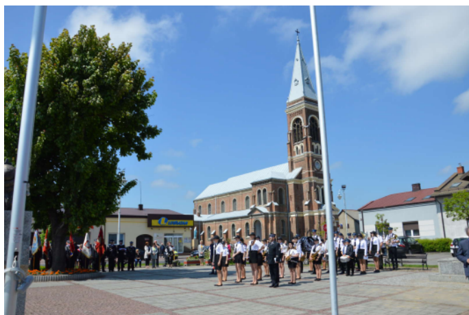
Młodzieżowa Orkiestra Dęta Dąbrowa Zielona