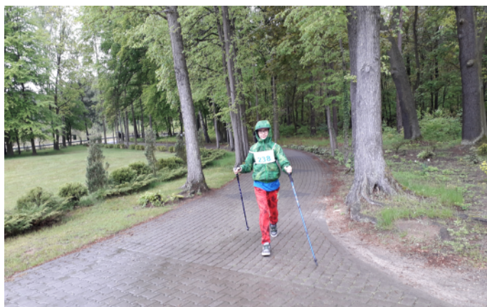
Na trasie marszu