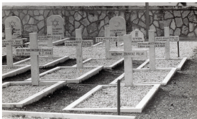
Cmentarz żołnierzy polskich w Loreto