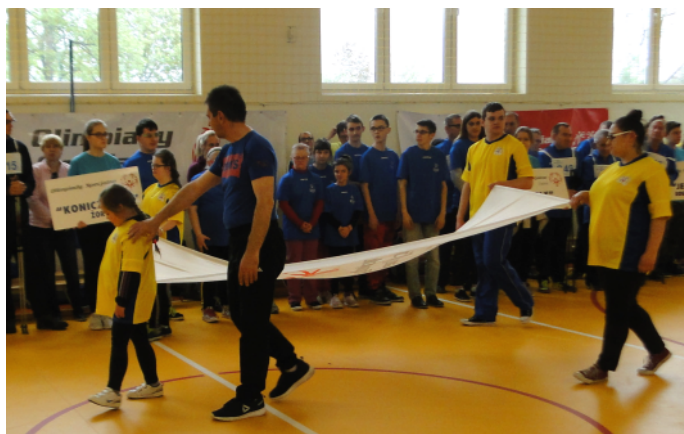
Wniesienie flagi Olimpiad Specjalnych