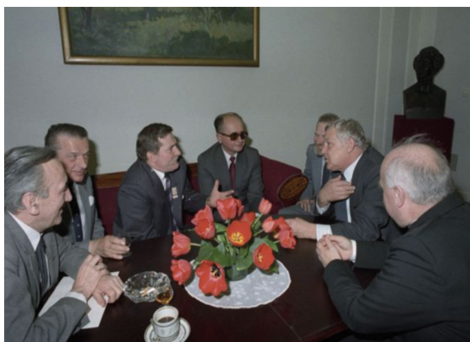
Rozmowy w ośrodku konferencyjnym MSW w Magdalence