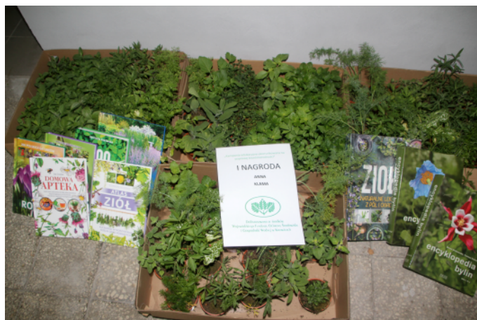
Laureaci otrzymali zestaw ziół i książek