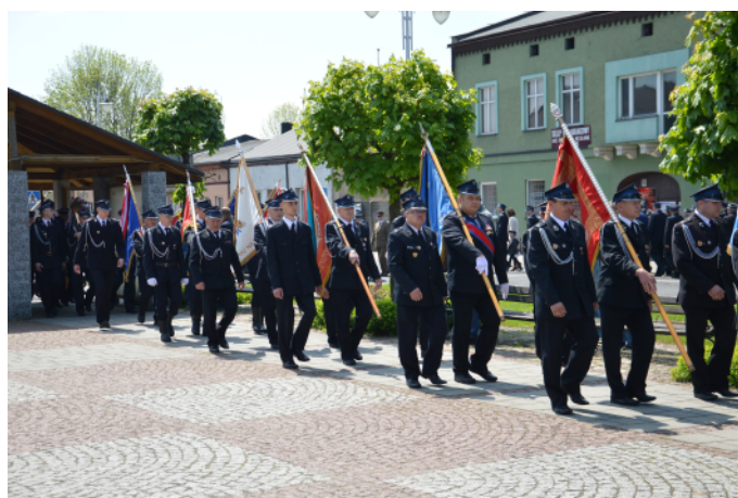
Początek sztafety sztandarowej OSP