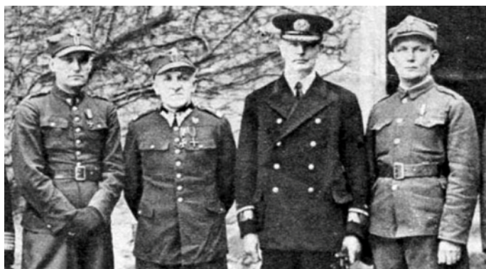
Admirał Józef Unrug w Oflagu w Colditz (trzeci z lewej)