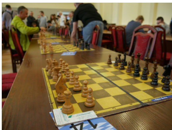
Na szachownicach rywalizowało 62 zawodników