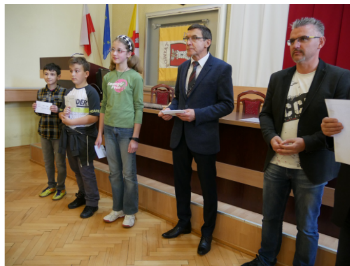
Najmłodszy laureaci z organizatorami