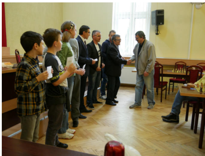
Gratulacje dla zwycięzcy