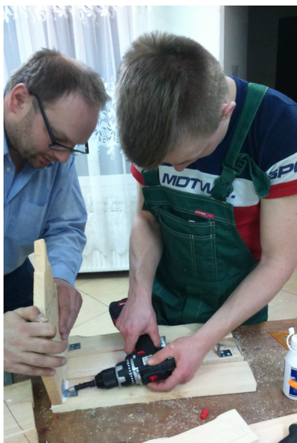
Pracownia techniczna - drewna i metalu