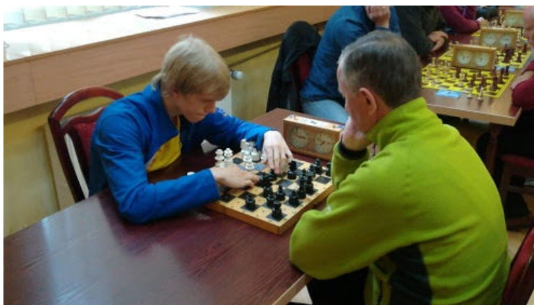
Partia grana na szachownicy brajlowskiej