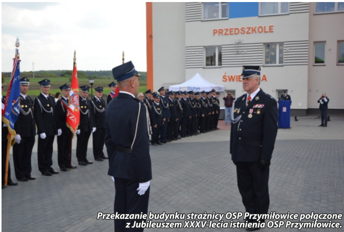
Przekazanie budynku strażnicy OSP Przymiłowice połączone z Jubileuszem XXXV-lecia istnienia OSP Przymiłowice.

Strażacy byli zawsze podporą naszego społeczeństwa. Mają znaczący udział w walce o niepodległość Ojczyzny, płacąc - gdy trzeba - najwyższą cenę życia i zdrowia za jej odzyskanie i obronę w chwilach zagrożenia. Kolejne pokolenia pełnią piękną, coraz bardziej wymagającą społeczną służbę. W dzień powszedni i święto tysiące ratowników czuwają nad bezpieczeństwem bliźnich. Wierni tradycji organizują również aktywność lokalnych społeczności.