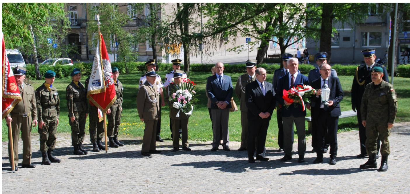
Złożenie kwiatów pod pamiątkową tablicą

Uroczystości z okazji 100. rocznicy powstania Związku Inwalidów Wojennych Rzeczypospolitej odbyły się 26 kwietnia br. w kościele św. Jakuba i Ratuszu Miejskim w Częstochowie.