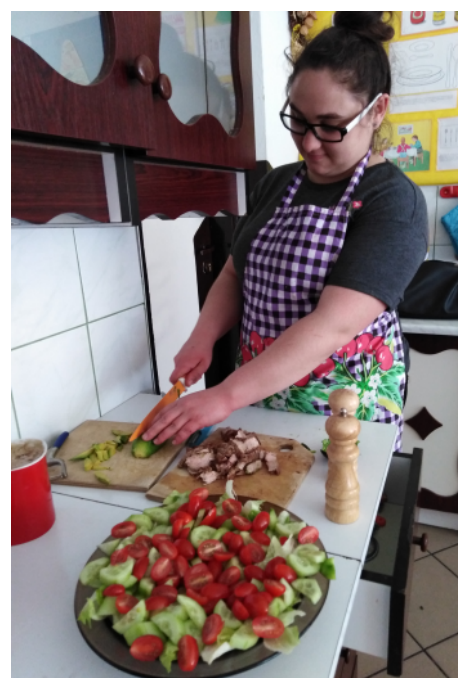
Pracownia „Kucharz małej gastronomii”