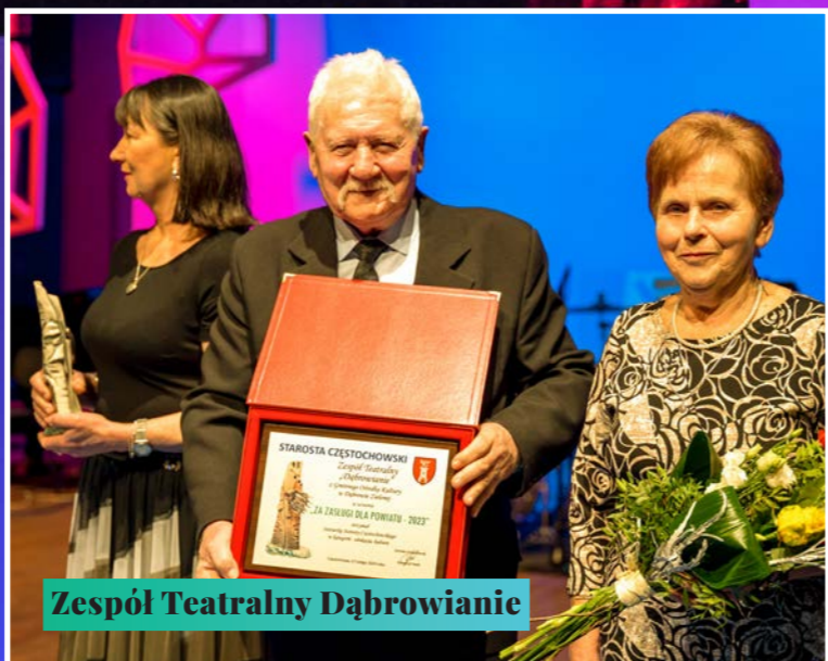
Zespół Teatralny Dąbrowianie