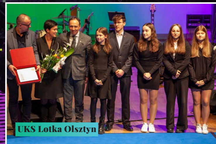
UKS Lotka Olsztyn