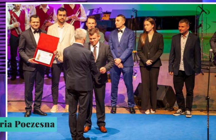
PKS Victoria Poczesna