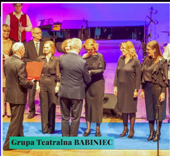
Grupa Teatralna BABINIEC