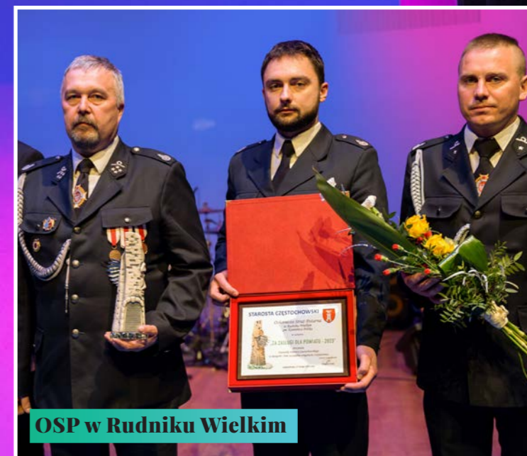
OSP w Rudniku Wielkim