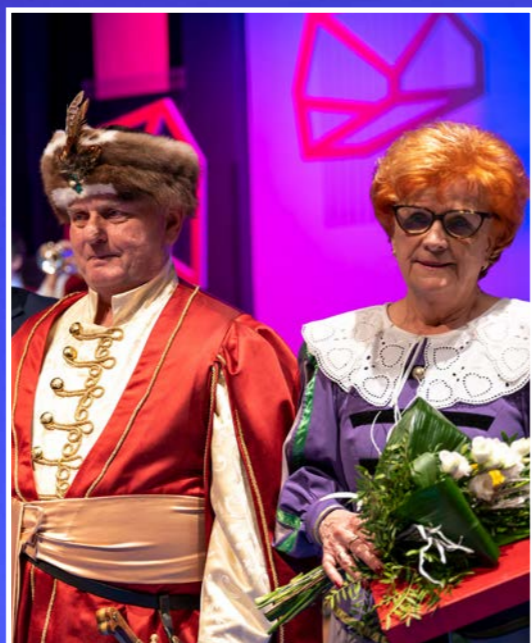
Zarząd Wspólnoty Gruntowej w Olsztynie