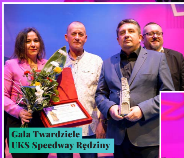
Gala Twardziele UKS Speedway Rędziny