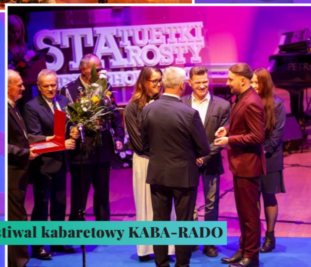
Festiwal kabaretowy KABA-RADO