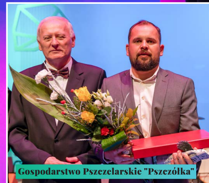
Gospodarstwo Pszczelarskie "Pszczółka"