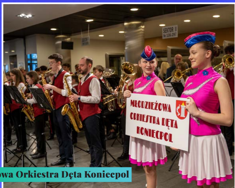
Młodzieżowa Orkiestra Dęta Koniecpoł