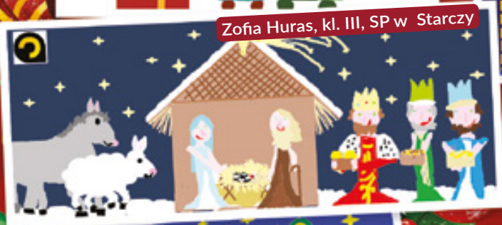
Zofia Huras, kl. III, SP w Starczy