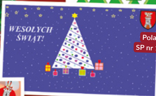
Pola Mysłak, kl. II, SP nr 1 w Konięcpolu