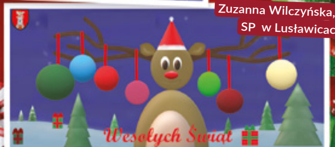
Zuzanna Wilczyńska, kl. VI SP w Luśwawicach