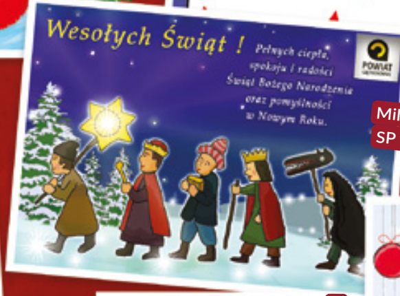
Milena Bąk, kl. VI, SP w Kłomnicach