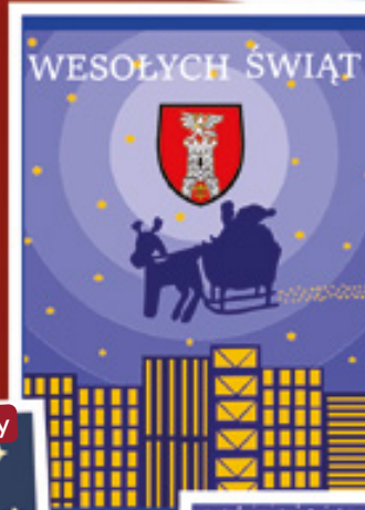
Lena Skiba, kl. VII, ZSP w Wierzbnowisku