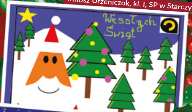
Mitosz Urzeniczok, kl. I, SP w Starczy