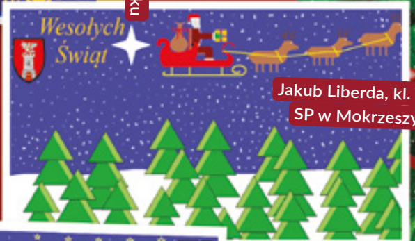
Jakub Liberda, kl. VII SP w Mokrzeszy