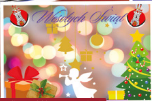
Natalia Góral, kl. V, ZSP w Lelowie